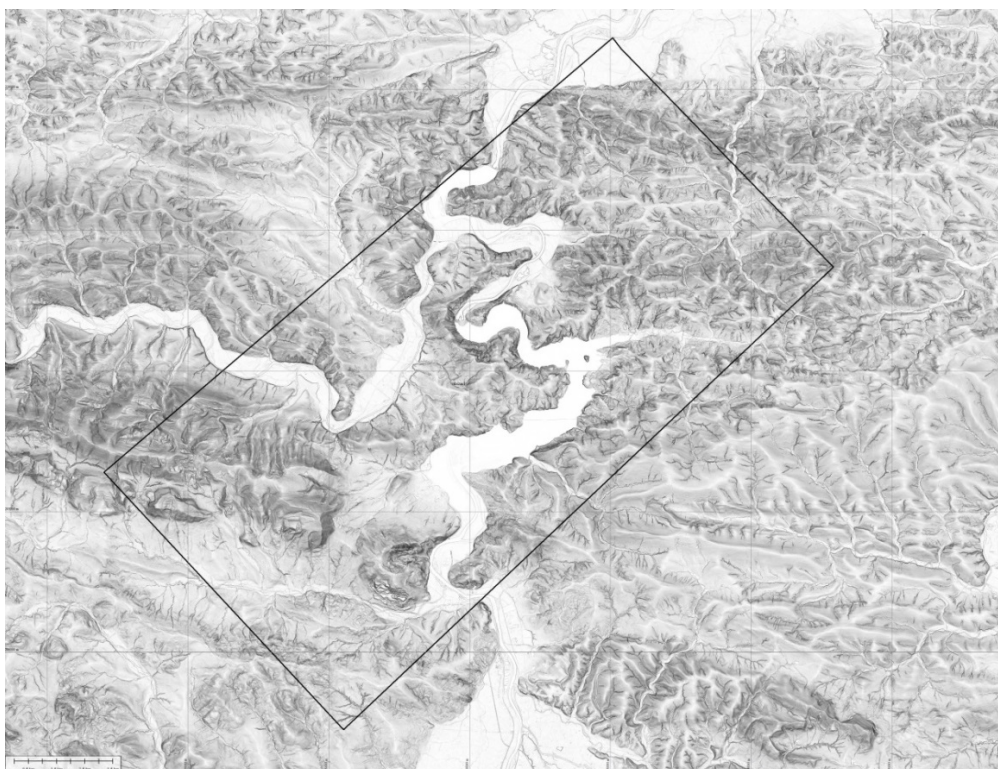
Zasięg obszaru LIDAR 1 (Blok 5)

Obszar określony został również załączonym w pliku wektorowym z przypisaną georeferencją obowiązującego systemu odniesień przestrzennych.