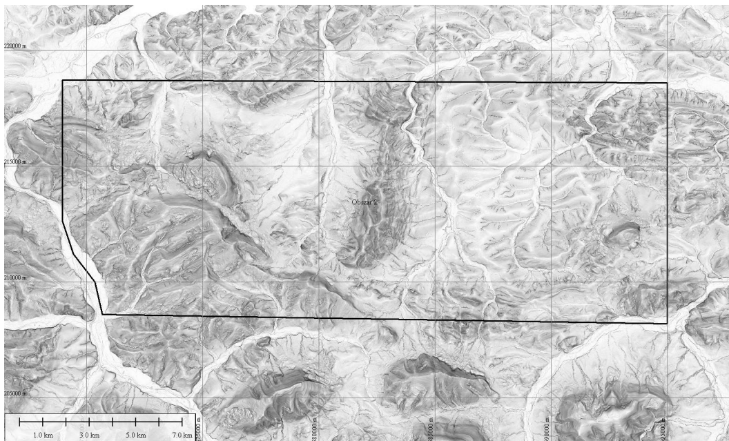
Zasięg obszaru LIDAR 2

1.3 Obszar LIDAR 3 to rejon gminy Strzyżów w województwie podkarpackim. Powierzchnia obszaru pomiarowego została ujęta wielokątem, którego zasięg wyznacza plik wektorowy.