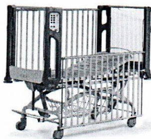
(Zdjęcie poglądowe oferowanego łóżka).

Czy (w pkt. 29) Zamawiający wyrazi zgodę na zaoferowanie łóżka bez listwy z obu stron łóżka?