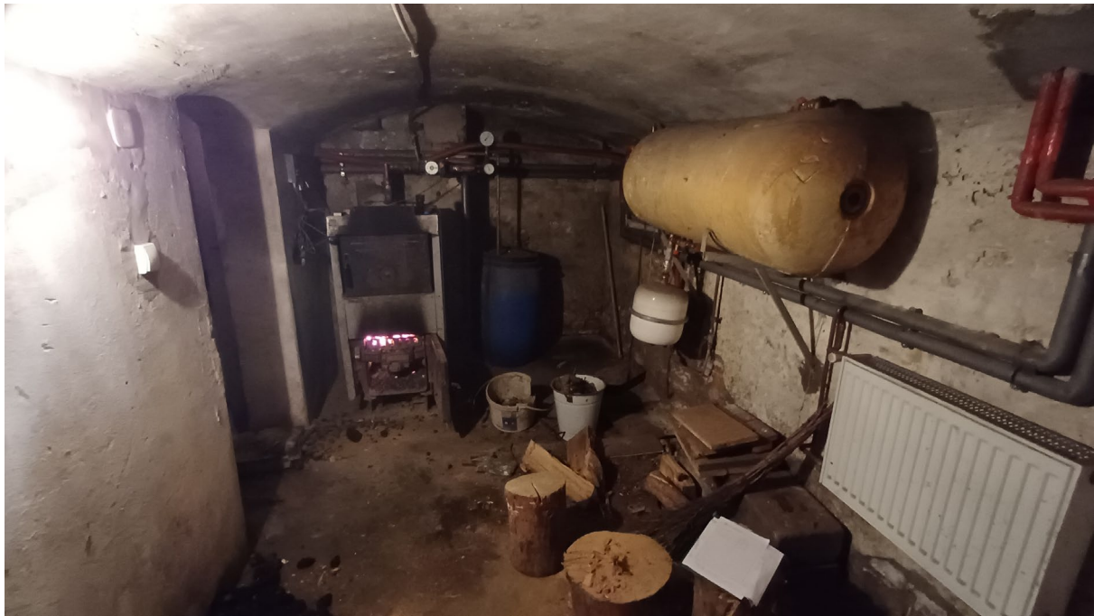
Zdjęcie przedstawia miejsce instalacji kotła.

Wskazaniem jest, aby przed złożeniem oferty, Wykonawca przeprowadził wizję lokalną w celu oceny, na własną odpowiedzialność, wszelkich czynników (dostosowanie odpowiedniej technologii, dobór materiałów i urządzeń) wpływających na przygotowanie oferty i określenie ceny ryczałtowej.