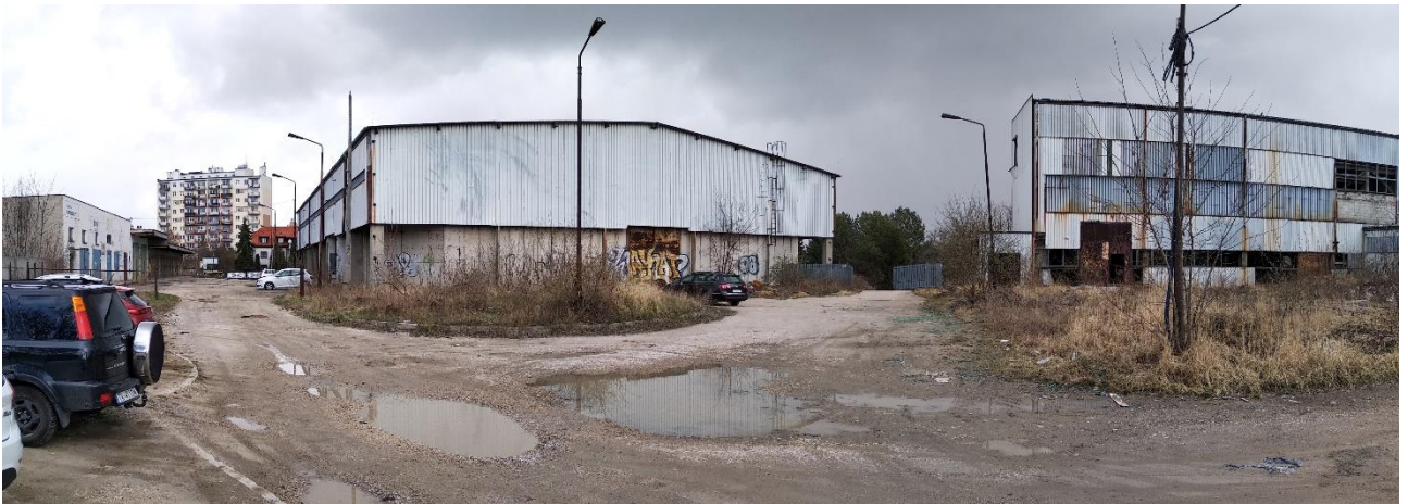
Budynek nr 2 i 3 - widok od strony południowej i zachodniej, Fot. 2022 r.