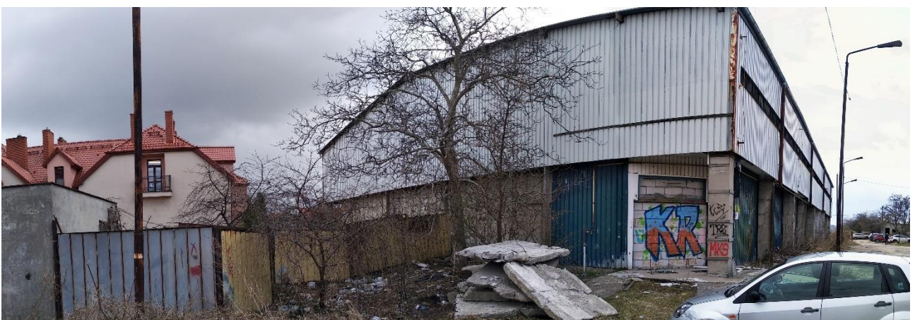
Budynek nr 3 - widok od strony północnej, Fot. 2022 r.