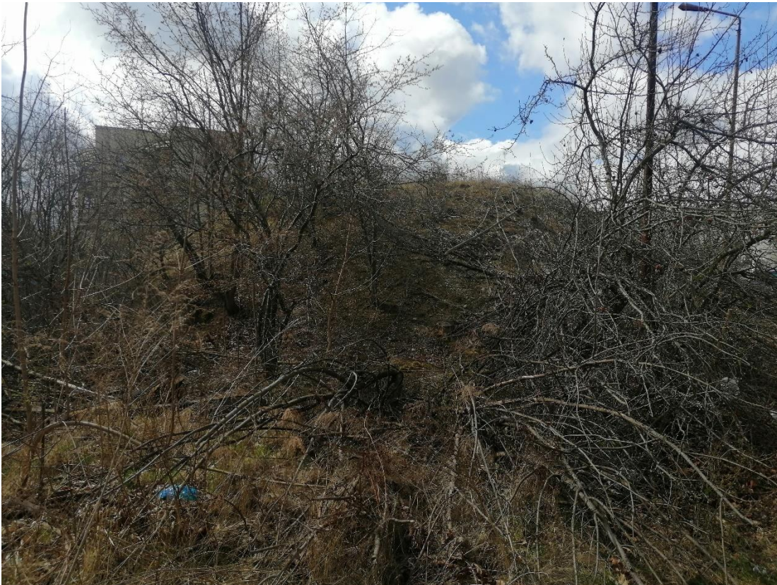
Zbiornik na wodę (2 szt.) nr 5 - widok od strony południowej, Fot. 2022 r.