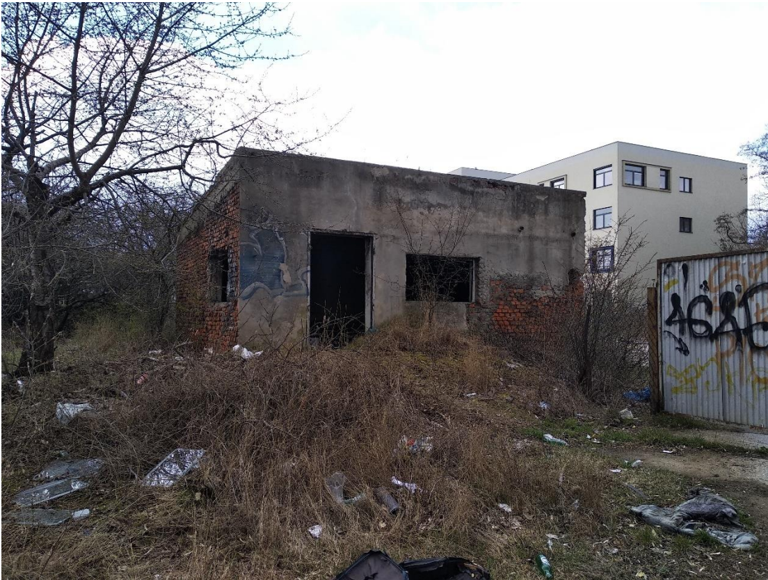
Budynek nr 4 – widok od strony północnej, Fot. 2022 r.