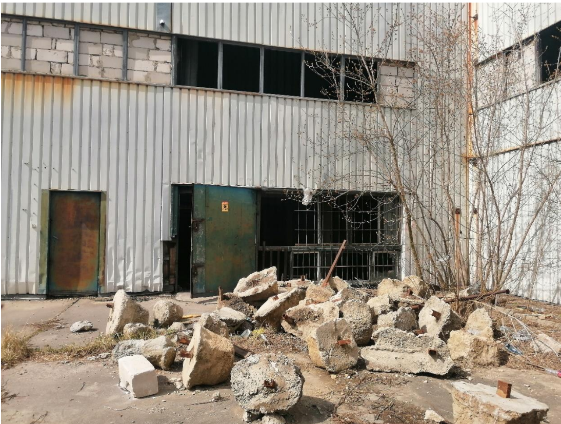
Bloki betonowe przeznaczone do utylizacji przed budynkiem nr 1 i 2 – widok od strony wschodniej, Fot. 2022 r.