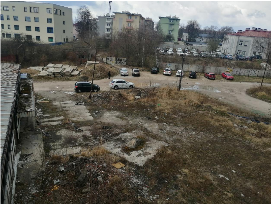
Plac przed budynkiem nr 1 i 2 od strony zachodniej, Fot. 2022 r.