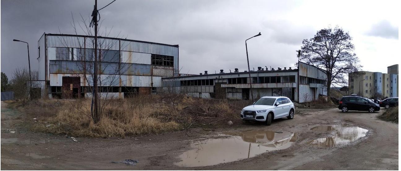
Budynek nr 1 i 2 – widok od strony zachodniej, Fot. 2022 r.