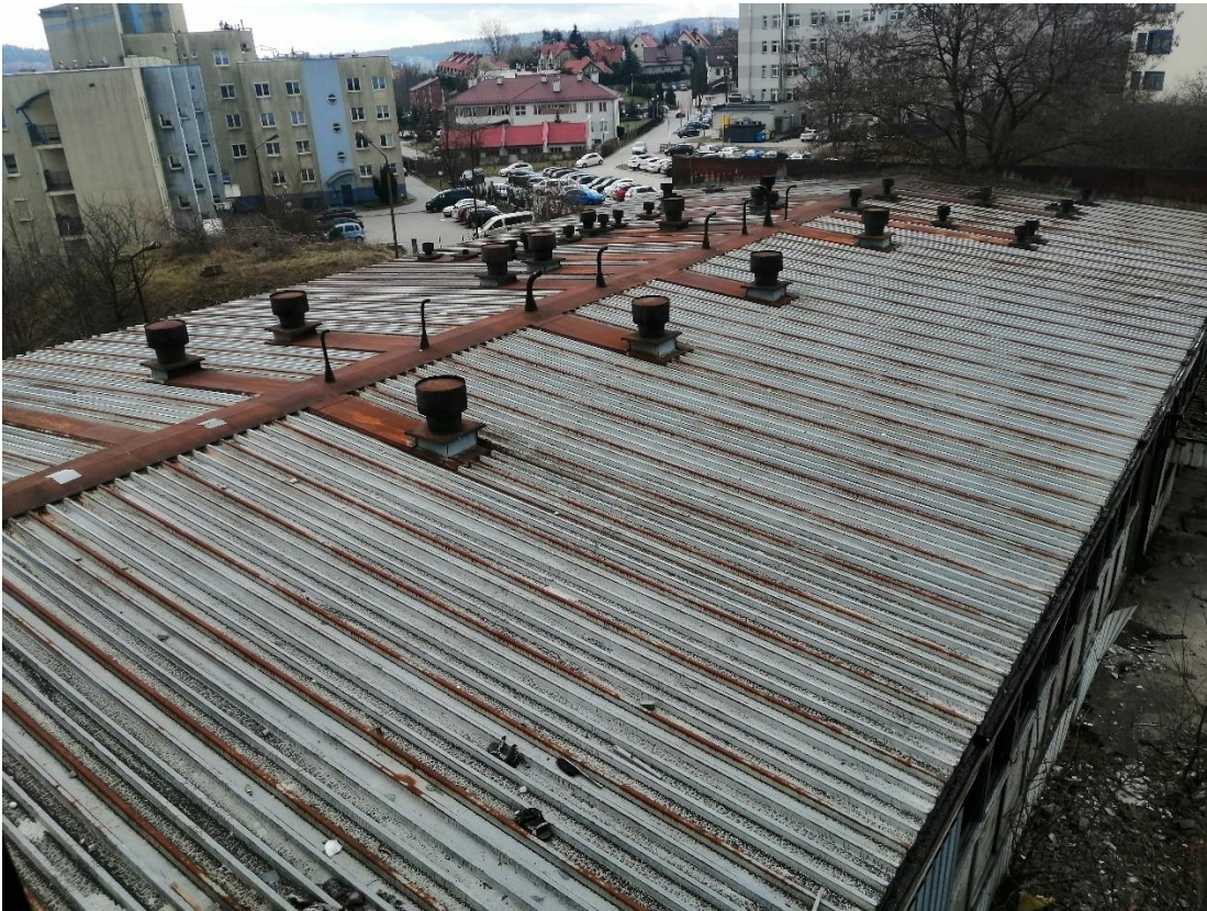
Budynek nr 1 – widok dachu, Fot. 2022 r.