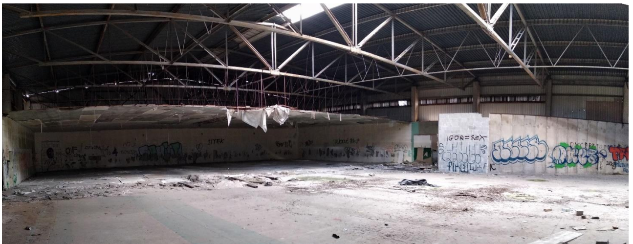
Budynek nr 3 – widok od wewnątrz, Fot. 2022 r.