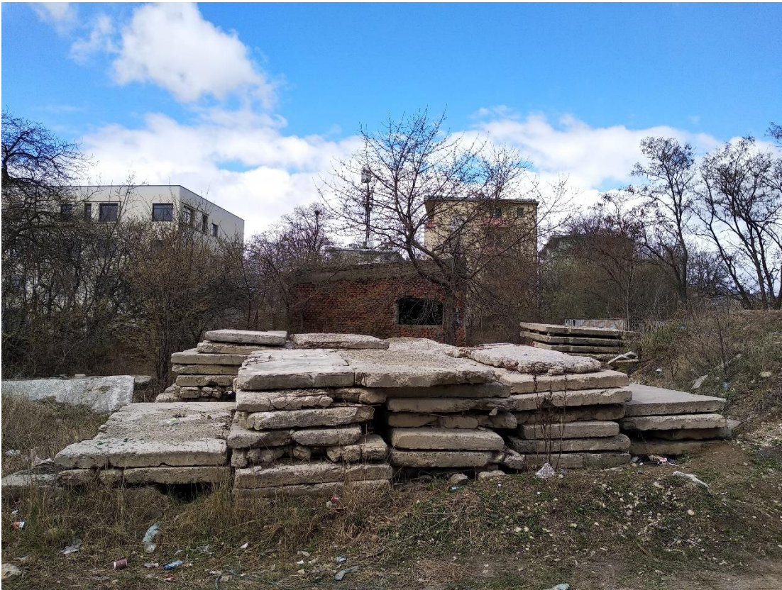
Bloki betonowe przeznaczone do utylizacji przed budynkiem nr 4, Fot. 2022 r.