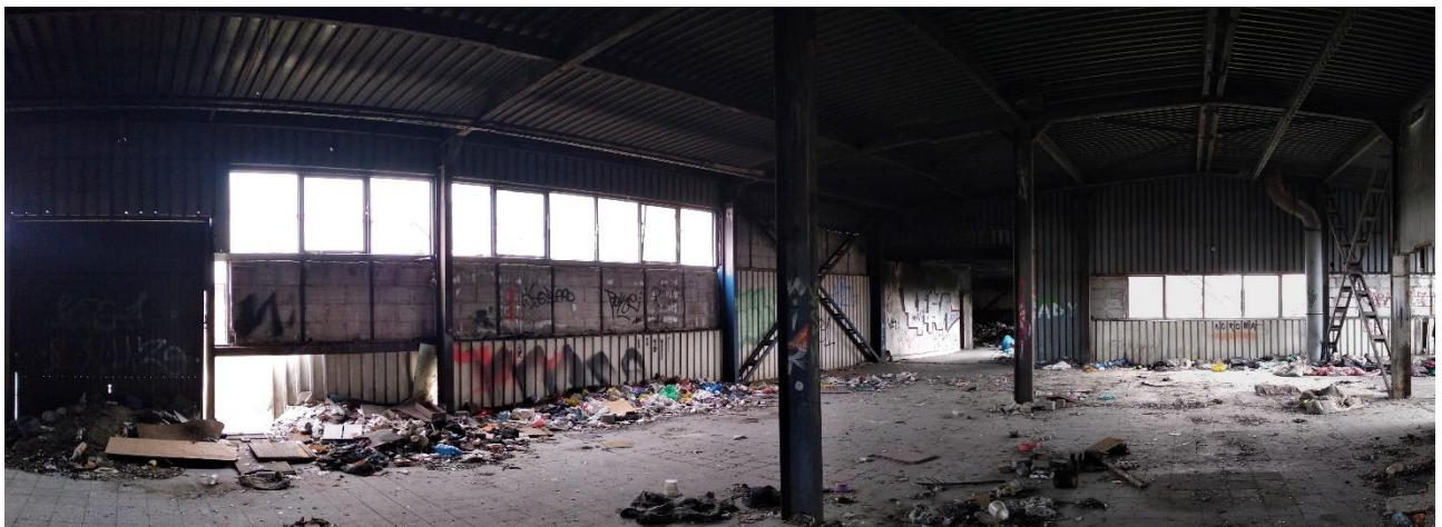
Budynek nr 1 – widok od wewnątrz, Fot. 2022 r.