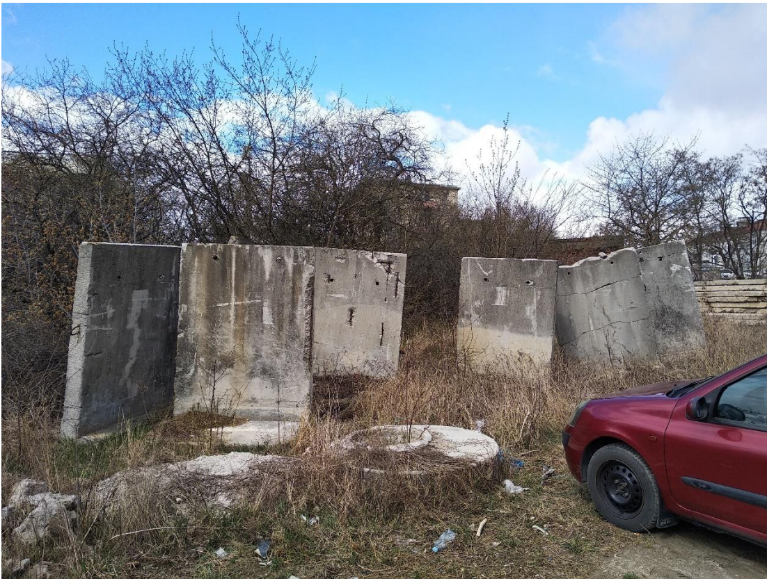
Bloki betonowe przeznaczone do utylizacji przed budynkiem nr 4, Fot. 2022 r.