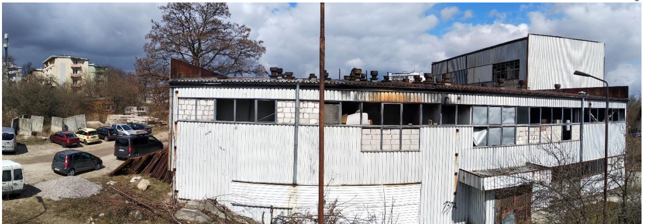
Budynek nr 1 - widok od strony południowej, Fot. 2022 r.