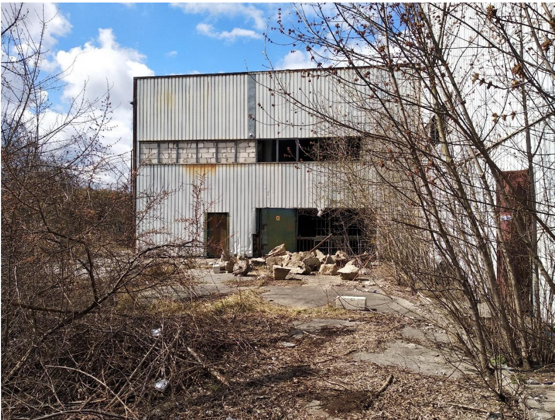
Budynek nr 1 i 2 – widok od strony wschodniej, Fot. 2022 r.