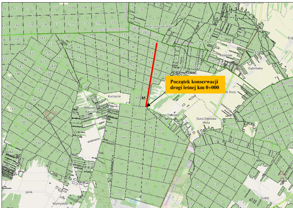
Rysunek 1. Lokalizacja przebiegu konserwacji drogi leśnej wraz z jej początkiem.