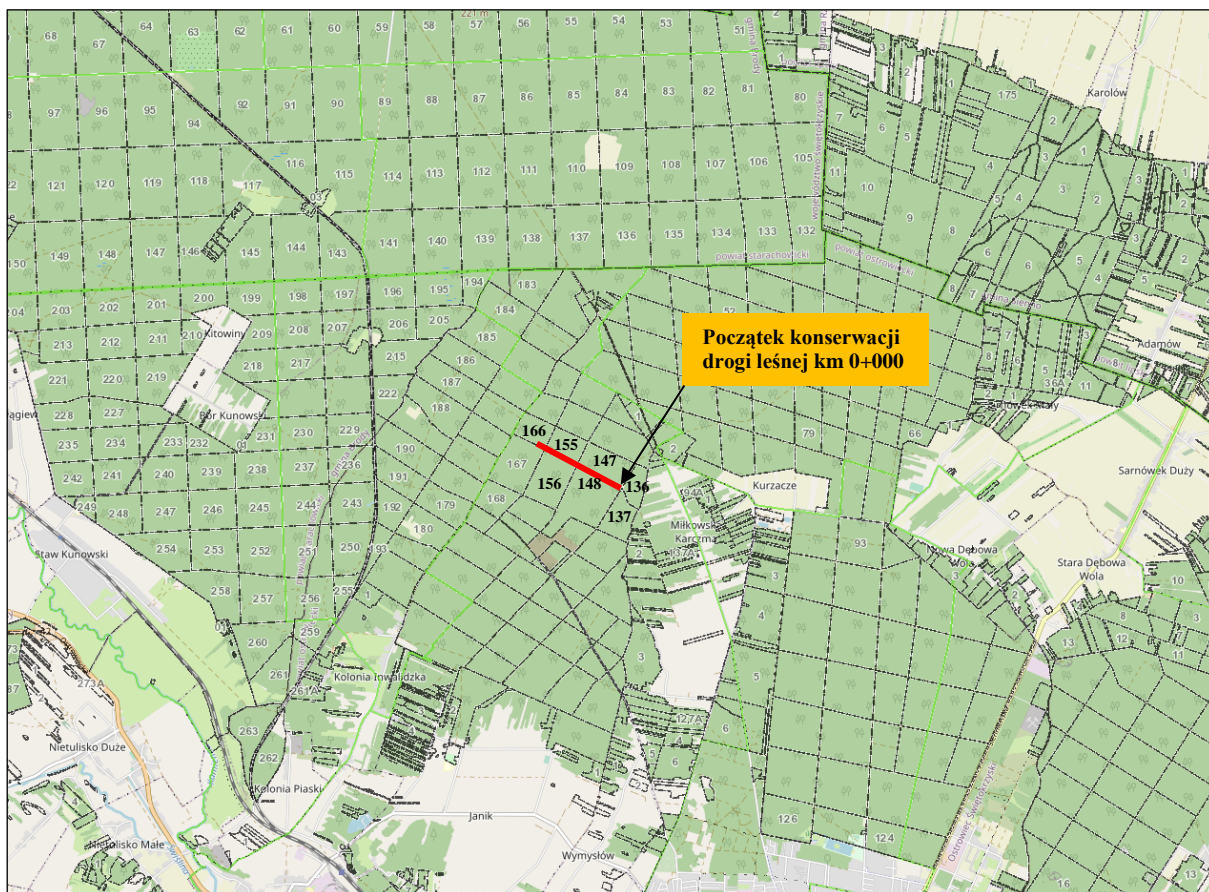
Rysunek 1. Lokalizacja przebiegu konserwacji drogi leśnej wraz z jej początkiem.