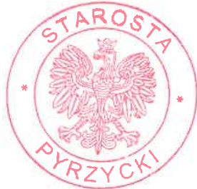
..... (pieczęć okrągła)

Jednocześnie w trakcie biegu terminu do wniesienia odwołania strony mogą zrzec się prawa do wniesienia odwołania w formie oświadczenia, z dniem doręczenia organowi administracji publicznej w/w oświadczenia decyzja staje się ostateczna i prawomocna.