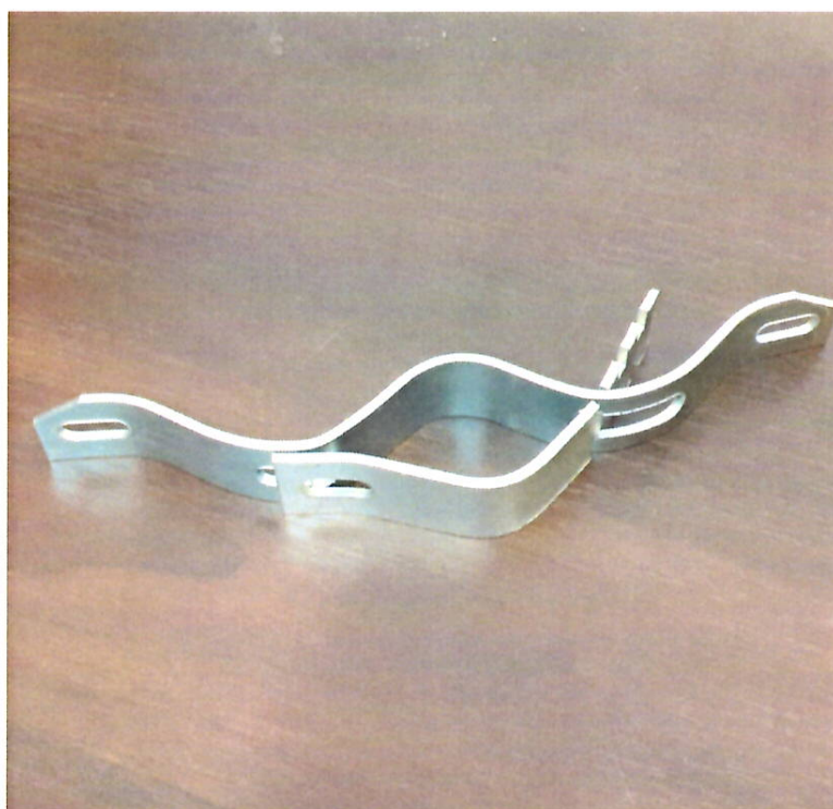
Rys.2. Uchwyt uniwersalny