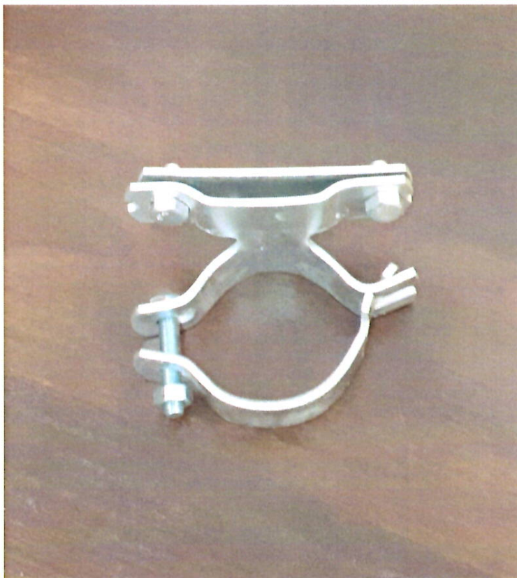
Rys.1. Uchwyt szczękowy/ zaciskowy