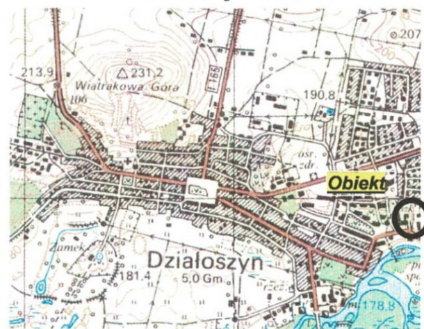
szkic lokalizacji 1:25000