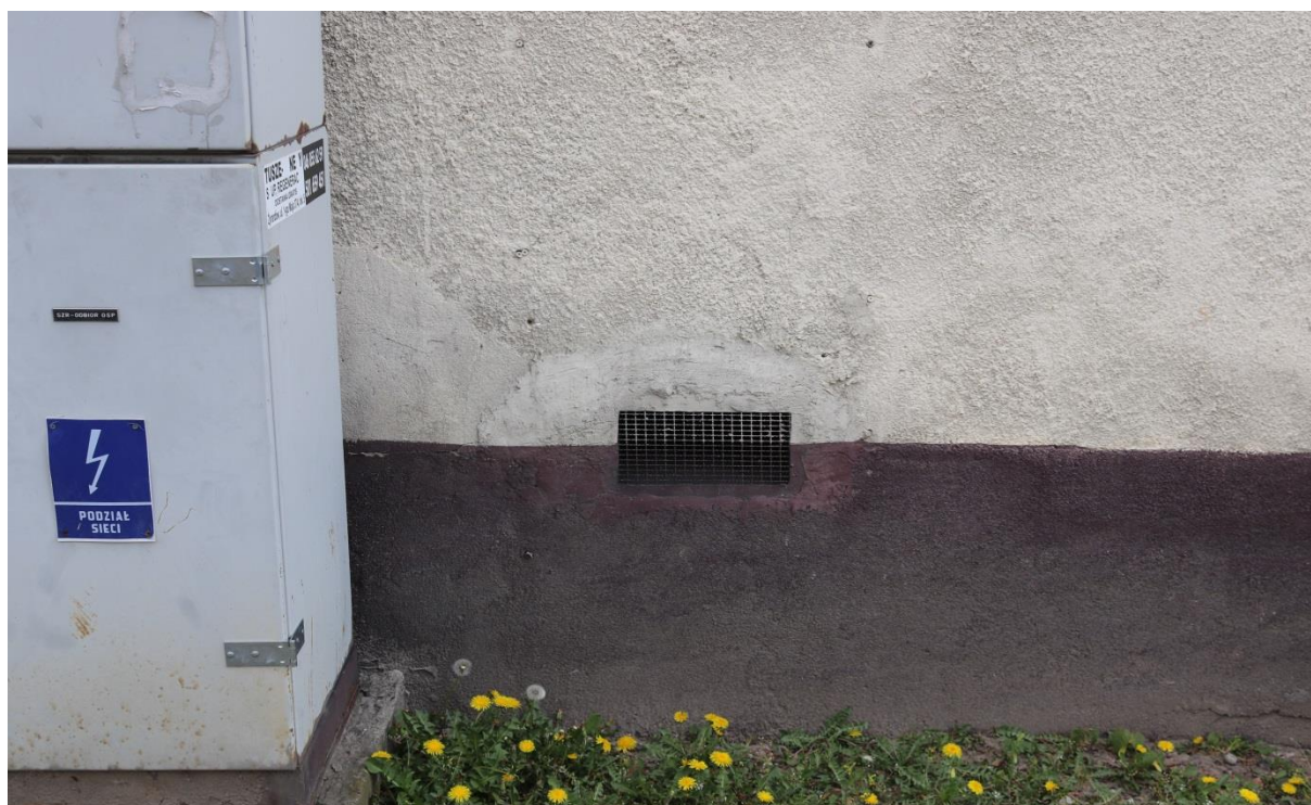
Sitaki i kratki zabezpieczające na budynku od strony ul. Rawskiej