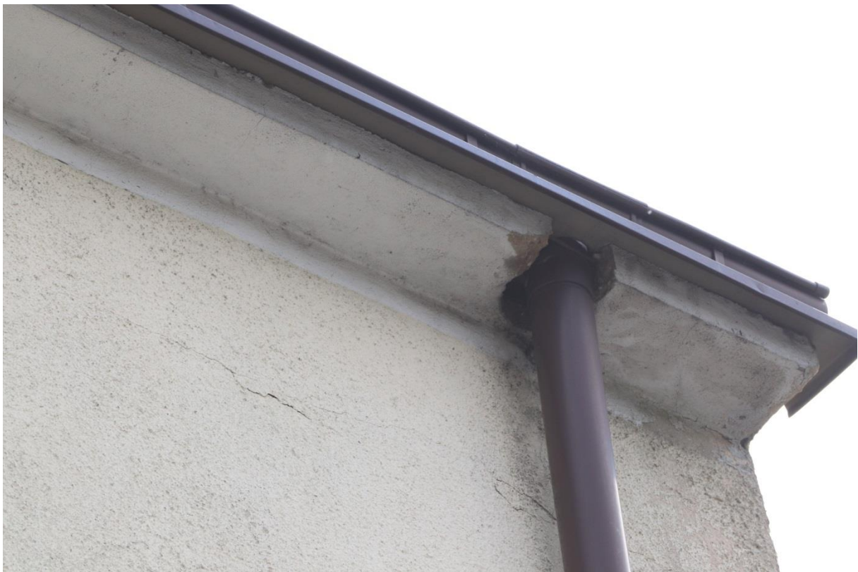
Otwór przy rynnie stanowiący wlot do gniazda mazurka