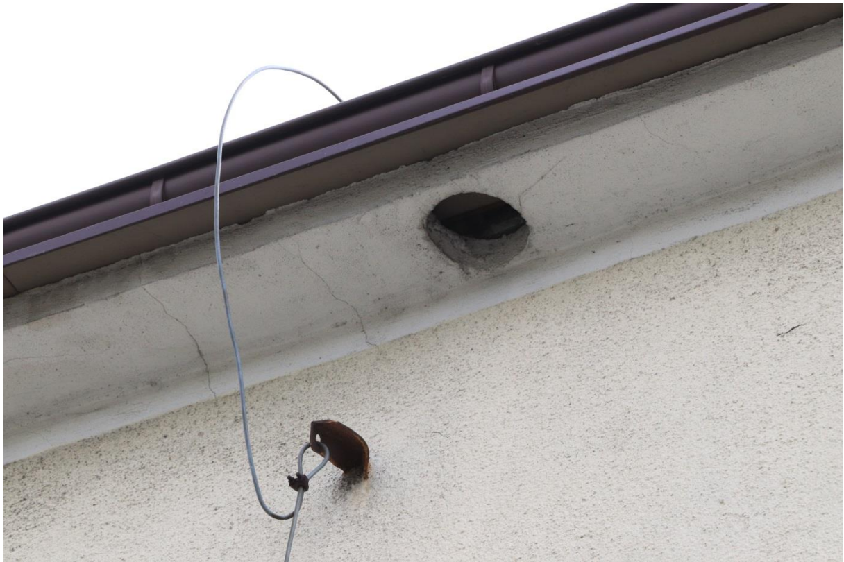
Otwór stanowiący wlot do gniazda mazurka