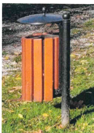
4) Rys. Istniejący kosz