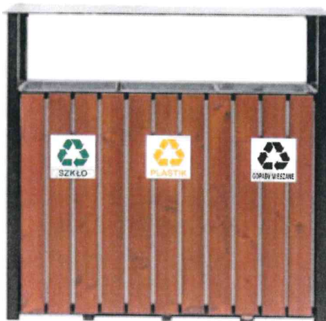
5) Rys. Zdjęcie poglądowe

Wymiary zewnętrzne kosza: wysokość minimalna: 85 cm, długość: 112 cm, szerokość: 37 cm, wysokość wkładu: 80 cm.