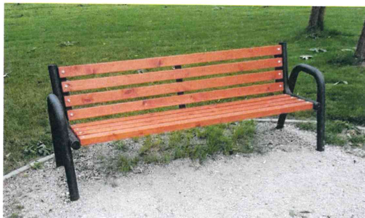
3) Rys. Istniejąca ławka