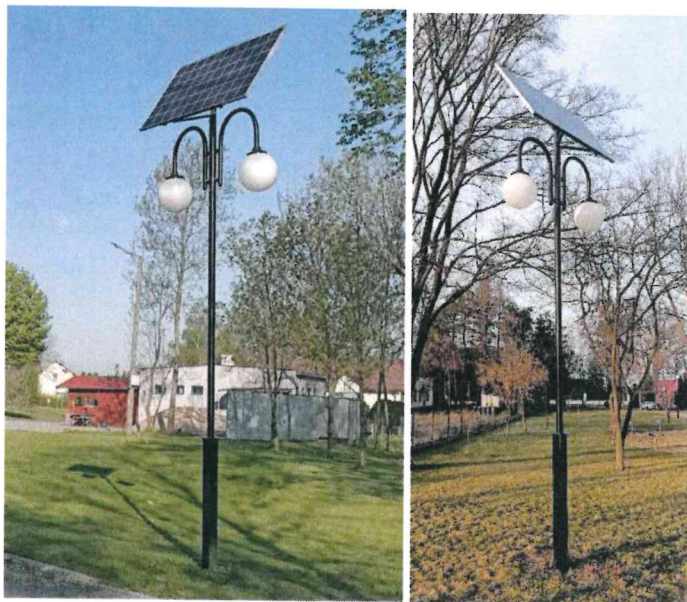
2) Rys. Istniejąca lampa solarna