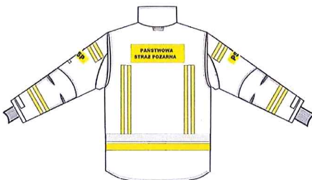
Przykładowy widok kurtki