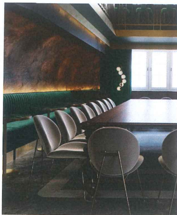
Rys. 2,3 Wizualizacja ściany łukowej wraz z sofą