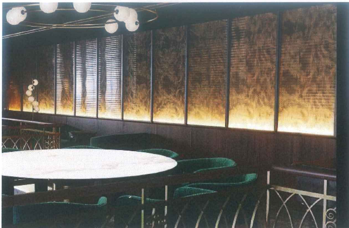
Rys. 1 Wizualizacja kasetonowych paneli ściennych