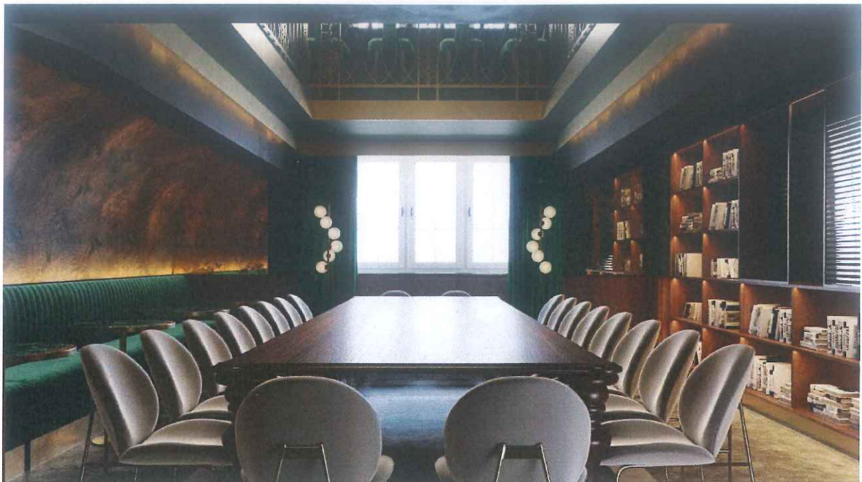
Rys. 4 Wizualizacja blendy otworu w stropie antresoli