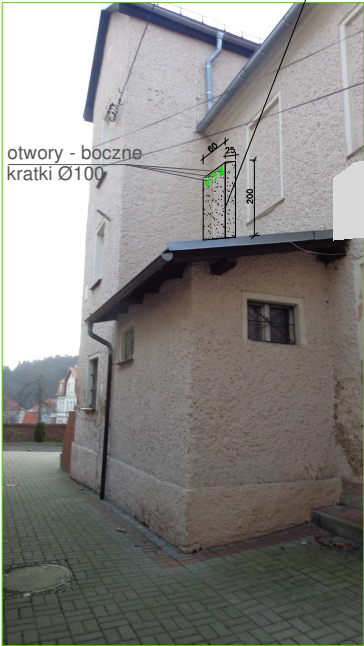
otwory - boczne kratki Ø100