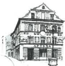
Kamienica „Pod Bykami”