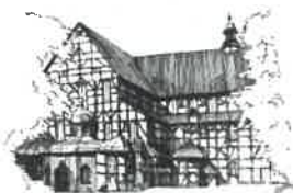
Kościół Pokoju pw. Św. Trójcy Wpisany na listę UNESCO