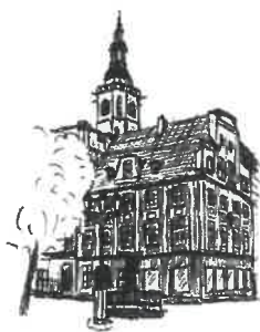
Rynek Wieża ratuszowa