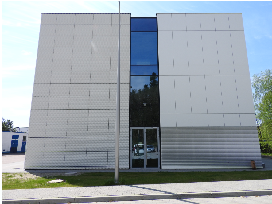
6. Elewacja boczna E-04 (prawa strona budynku).