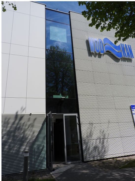
5. Elewacja boczna E-02 (lewa strona budynku).