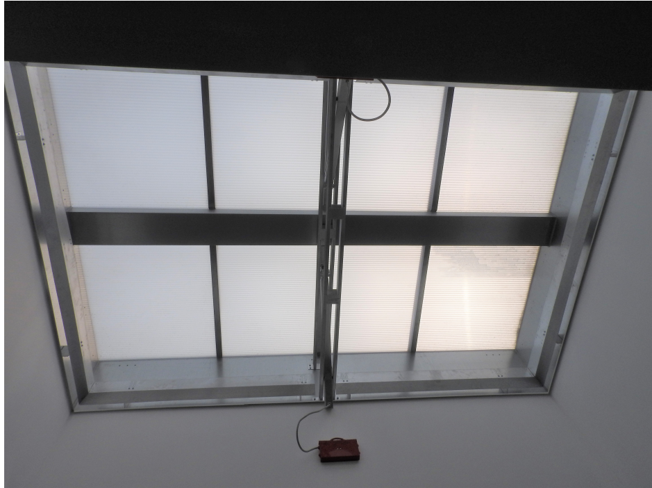
8. Kłapa oddymiająca (w dachu budynku)- strona wewnętrzna.