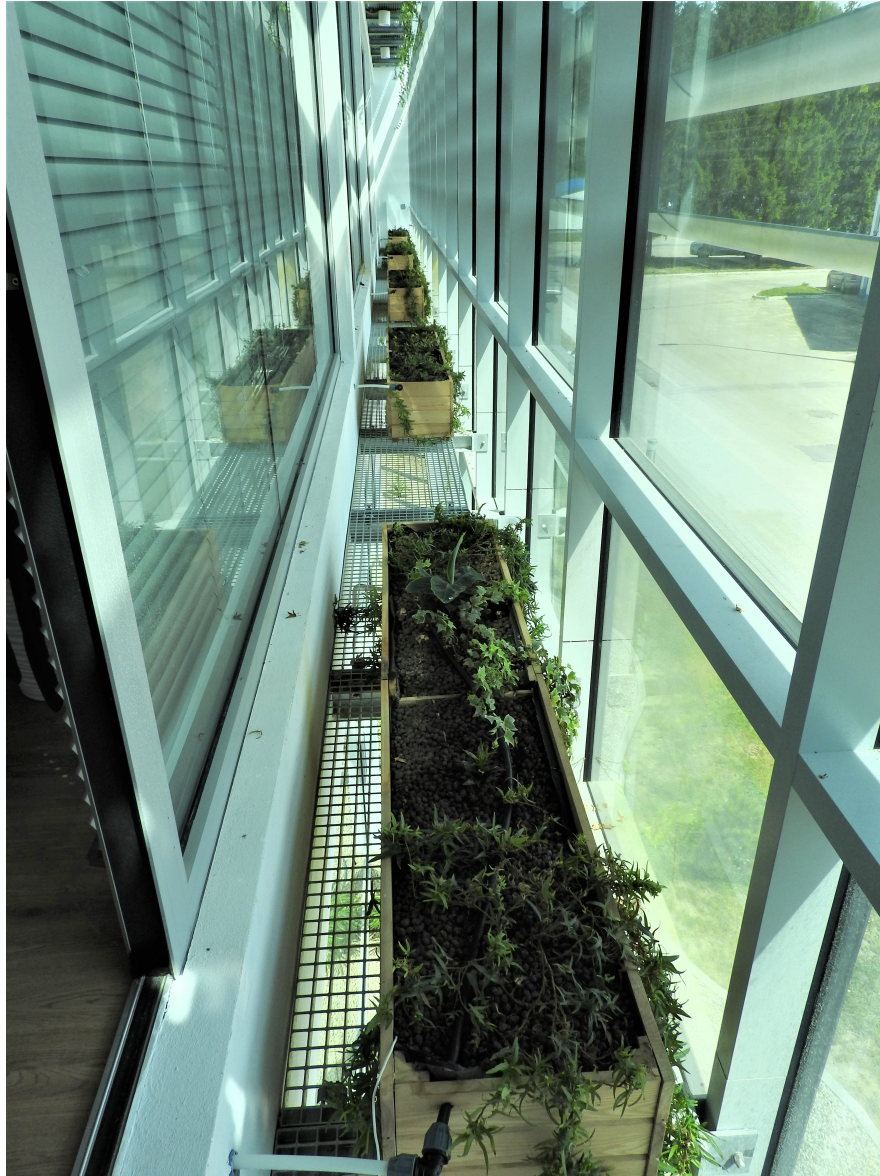
10. Ogród zimowy.