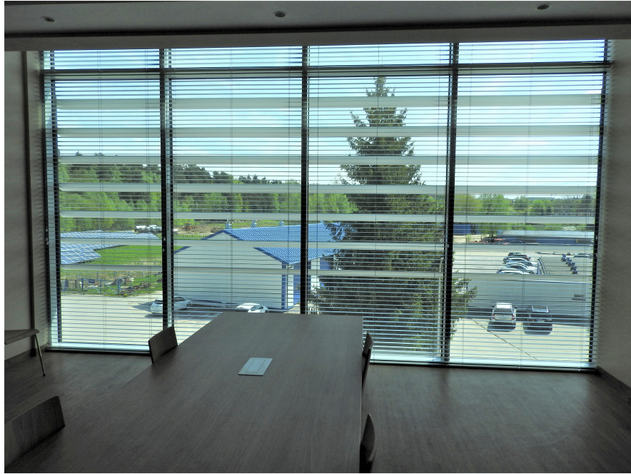
2. Elewacja E-01 strona wewnętrzna.