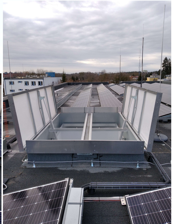
9. Kłapa oddymiająca (w dachu budynku)- strona zewnętrzna.