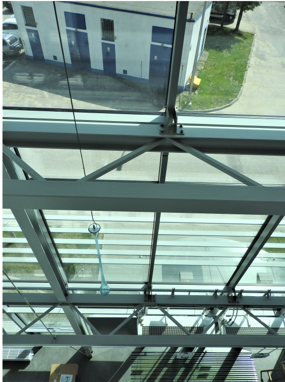
4. Klatka schodowa z wewnętrzną konstrukcją kratownicową (fragment).