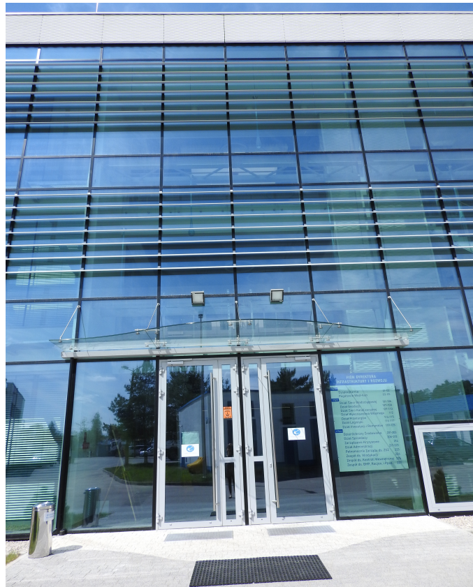
3. Wejście do budynku.