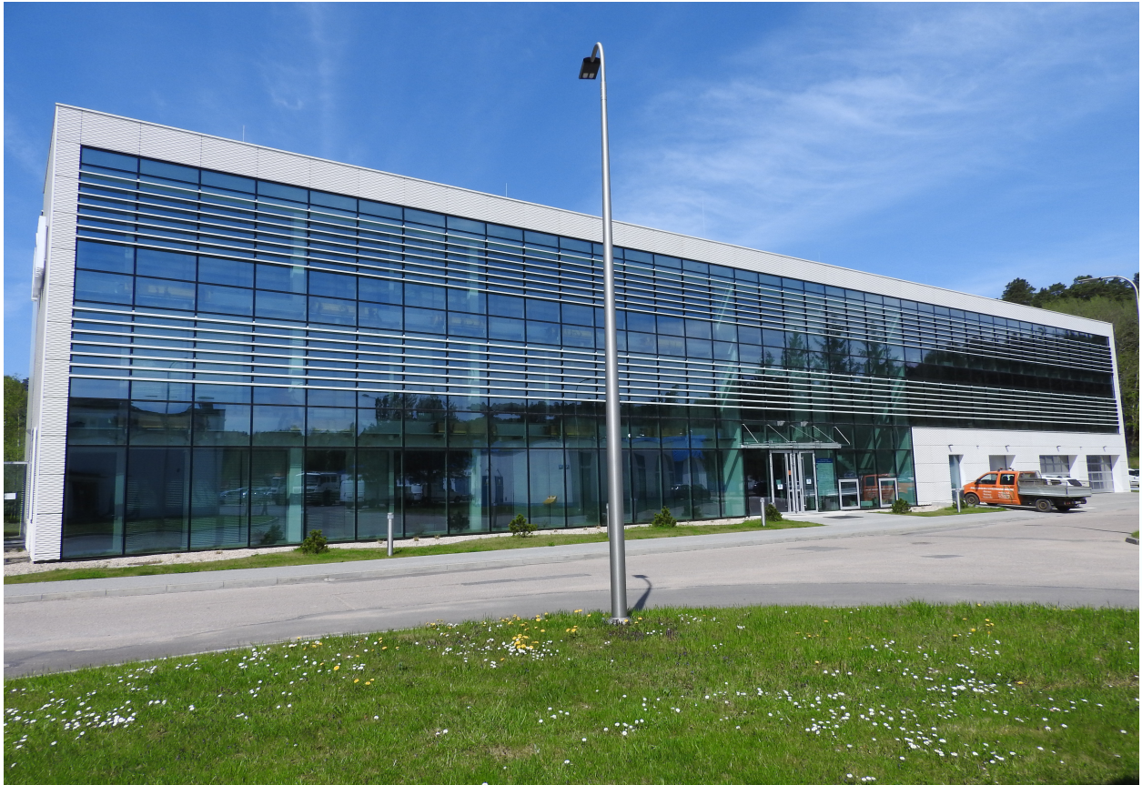
1. Elewacja E-01 (przód budynku).