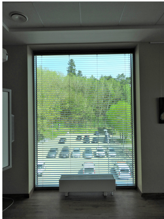
7. Elewacja boczna strona wewnętrzna.