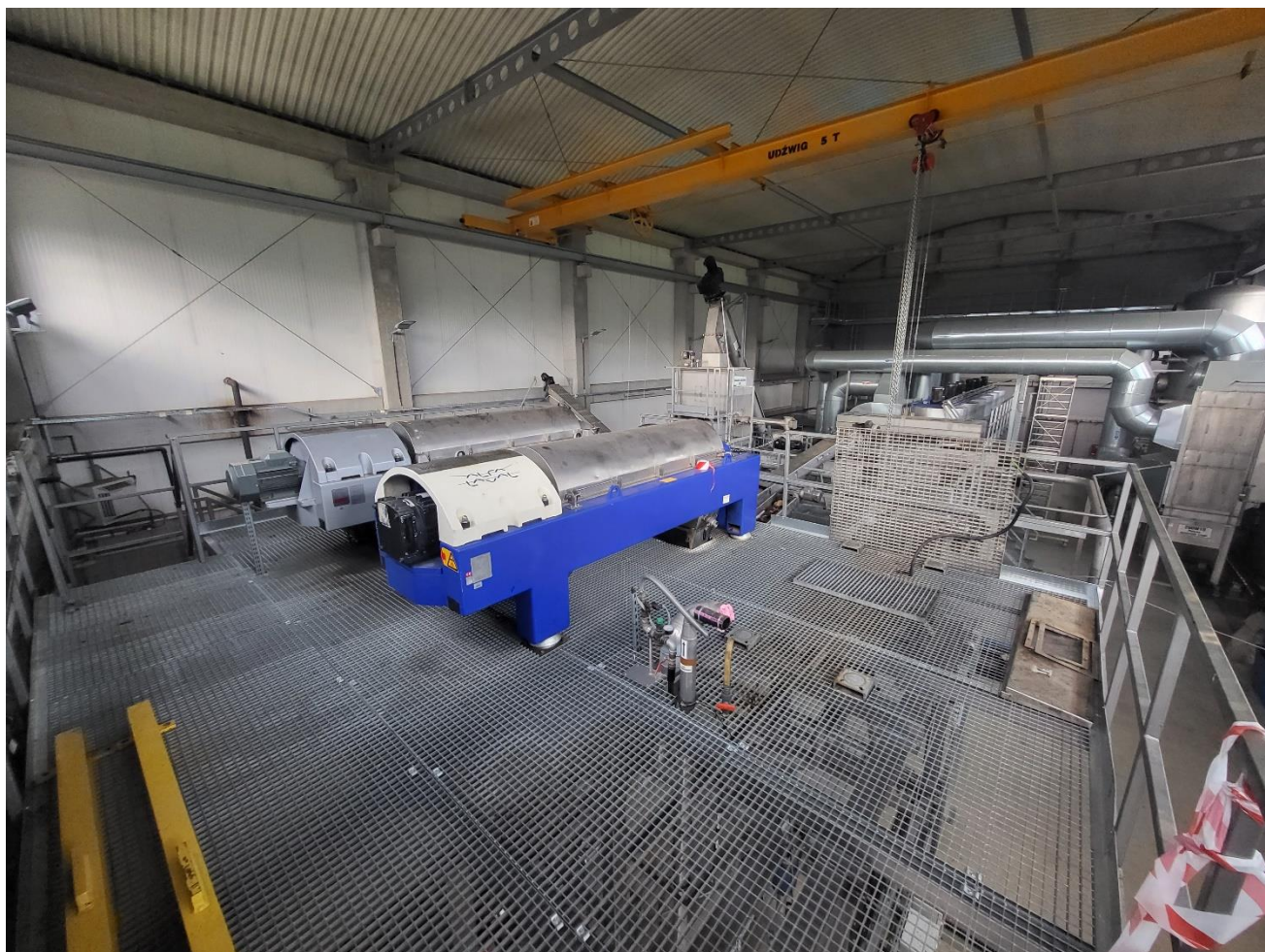
Zdj. 1 – Widok na wirówki, puste miejsce przeznaczone pod montaż nowego urządzenia

Z uwagi na wiek, znaczny stopień zużycia i nieefektywną pracę posiadanej wirówki dekantacyjnej podjęto decyzję o jej likwidacji i zakup nowego urządzenia. W chwili obecnej na oczyszczalni pracują dwie wirówki Alfa Laval: ALDEC G2- 60 oraz ALDEC 506. Nowe urządzenie musi być z nimi kompatybilne tak, aby dało się zsynchronizować ich pracę. Wirówki posadowione są na pomoście stalowym, wypełnionym kratami Wema. Ilość i rozmieszczenie wzmocnień obrazuje załącznik nr 2- rysunek techniczny. Wykonawca powinien uwzględnić, że konieczne będzie przerobienie elementów konstrukcyjnych podestu pod wymiary oferowanej przez siebie wirówki tak, aby konstrukcja bezpiecznie przenosiła obciążenia (obecne rozmieszczenie wzmocnień determinowały wymiary zlikwidowanej wirówki Guinard). W ramach dostawy planuje się również wymianę pompy nadawy osadu, pompy polimeru oraz przeróbkę podłączeń elektrycznych, AKPiA oraz wykonanie nowego, dodatkowego przenośnika ślimakowego, który umożliwi przenoszenie osadu bezpośrednio do zbiornika nadawy.