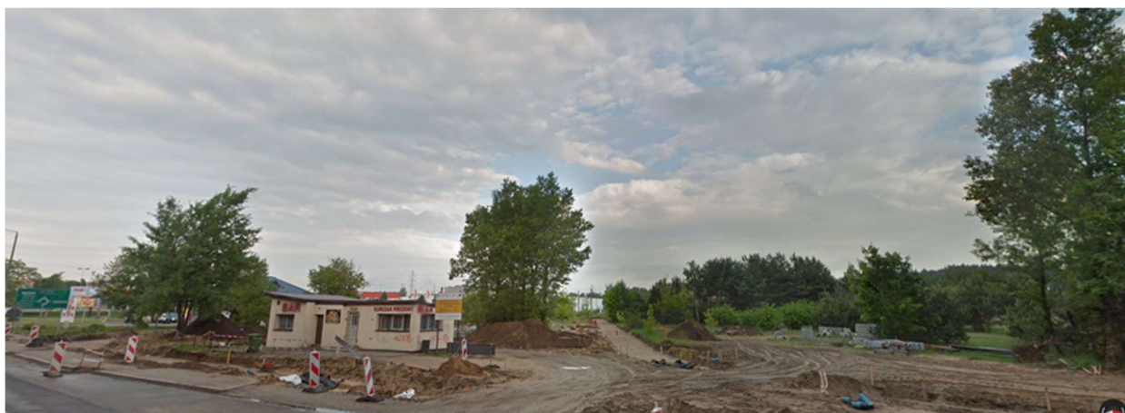
7.4. ul. Rataja, 86-300 Grudziądz – Centrum Opieki nad Zwierzętami