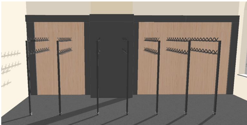
Obraz poglądowy okładziny z płyty meblowej.

Łączna powierzchnia zabudowy okładziną ścienną z płyty meblowej ok. 20 m 2