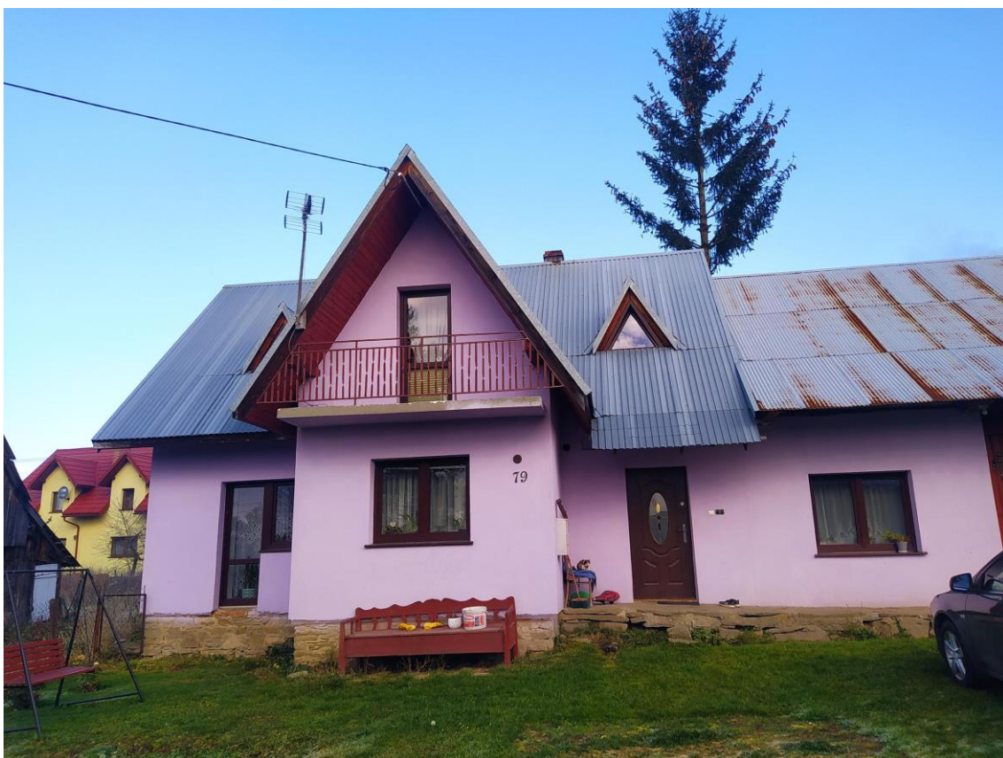
widok od strony S