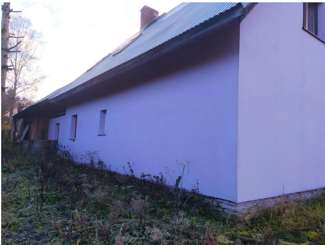
widok od strony N