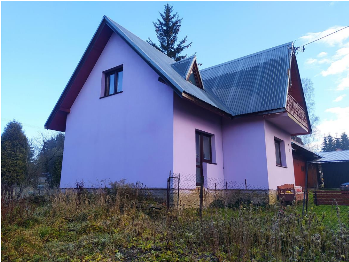
widok od strony W