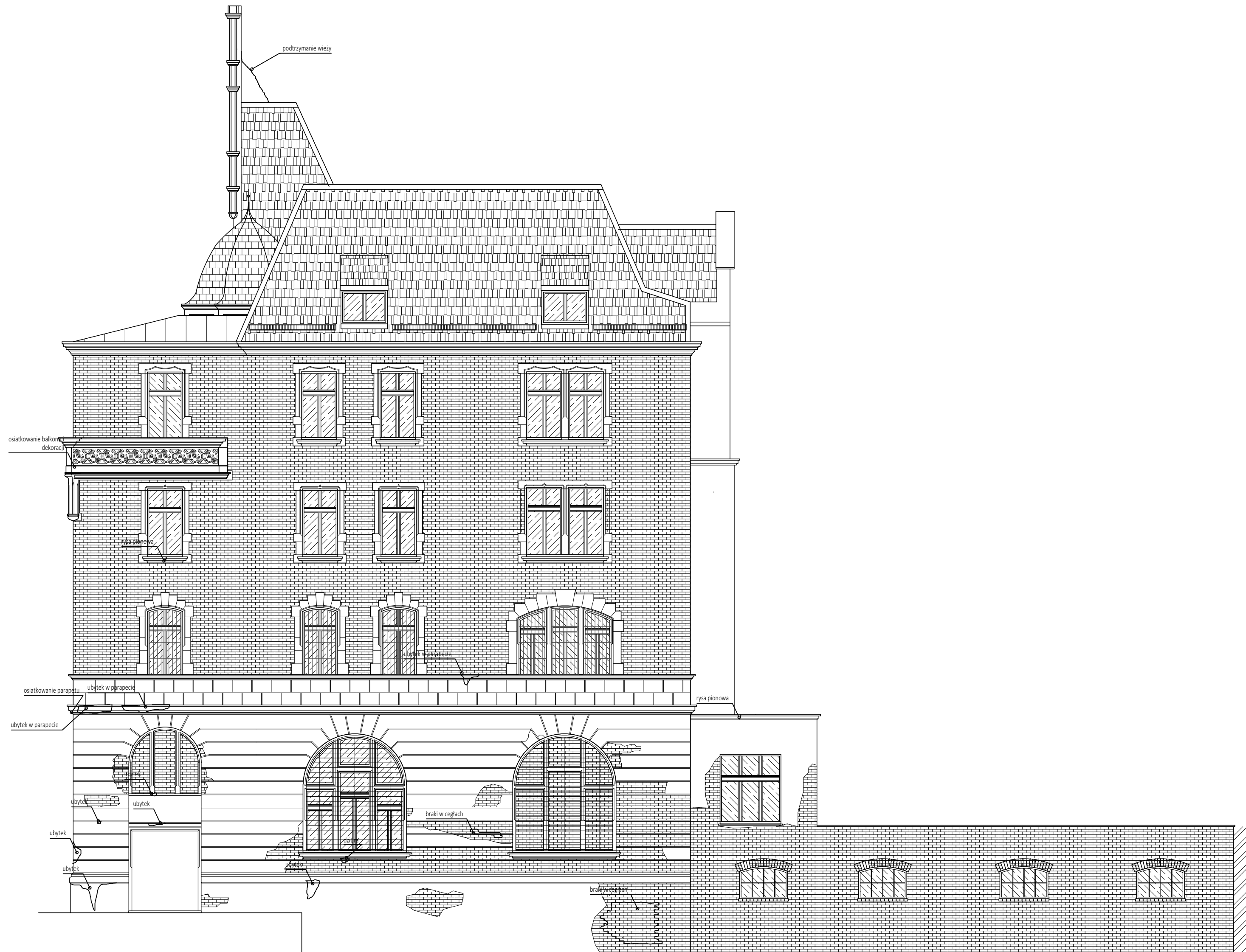
ELEWACJA POŁUDNIOWA II