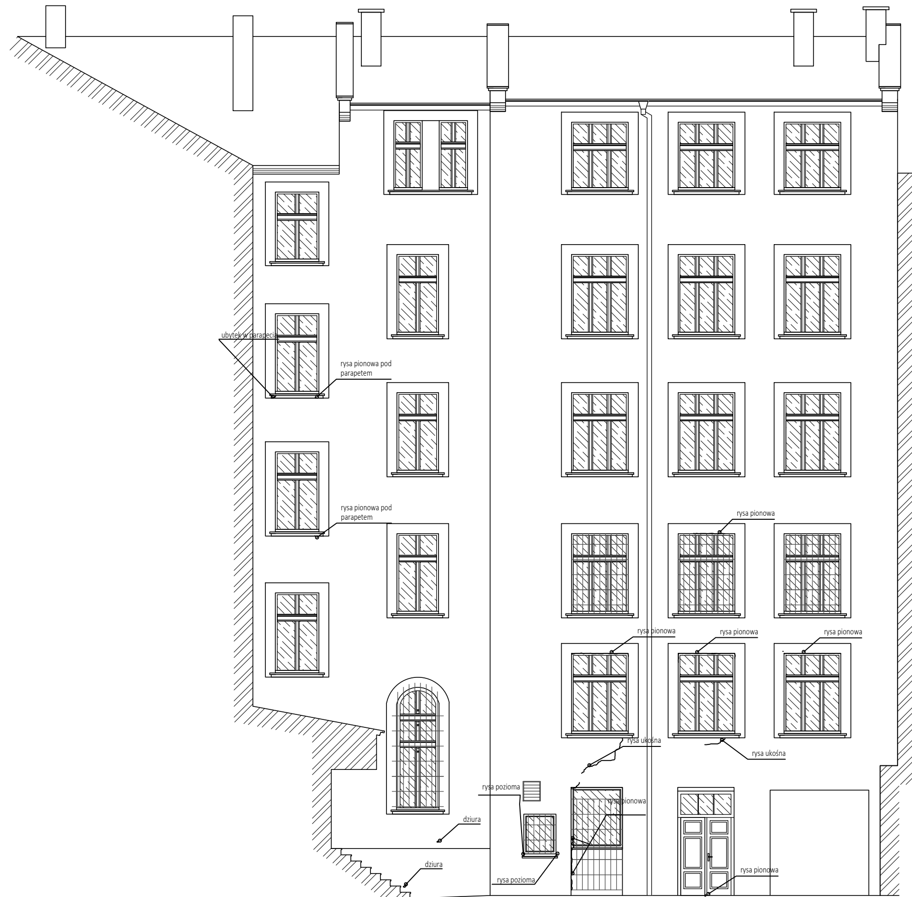
ELEWACJA POŁUDNIOWA I