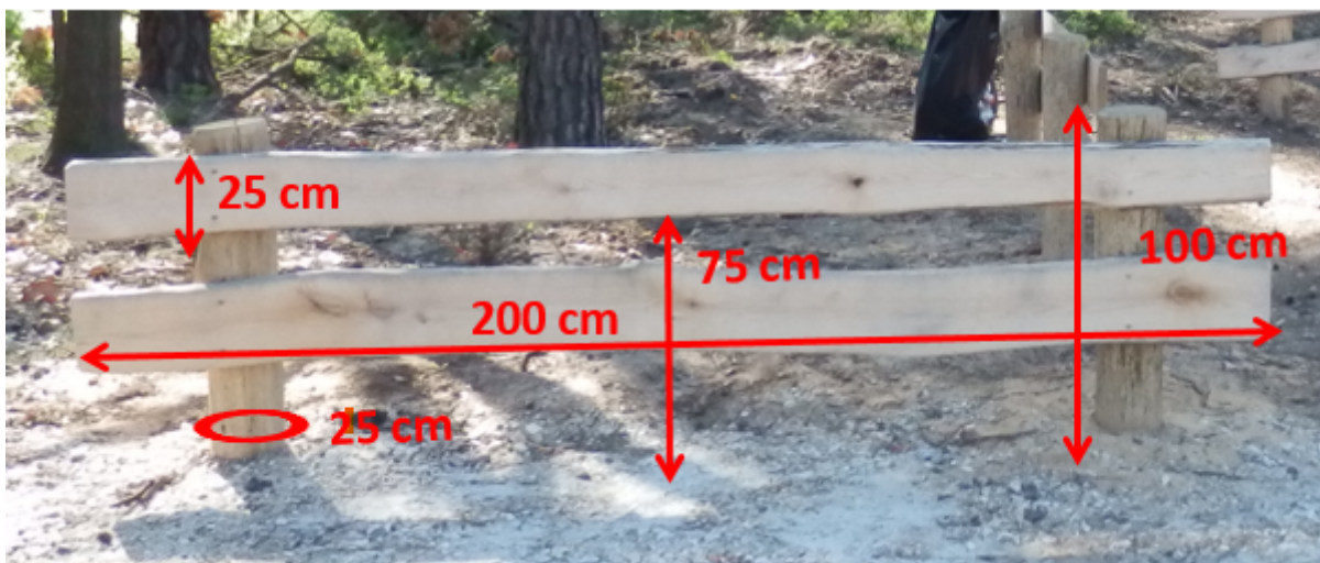
Ryc. 2. Wzór ogrodzenia z wymiarami