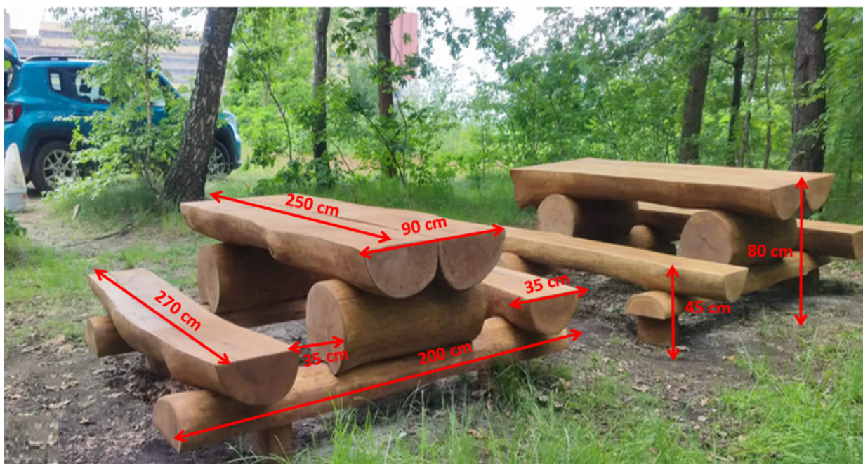
Ryc. 1. Wzór ławostółu z wymiarami