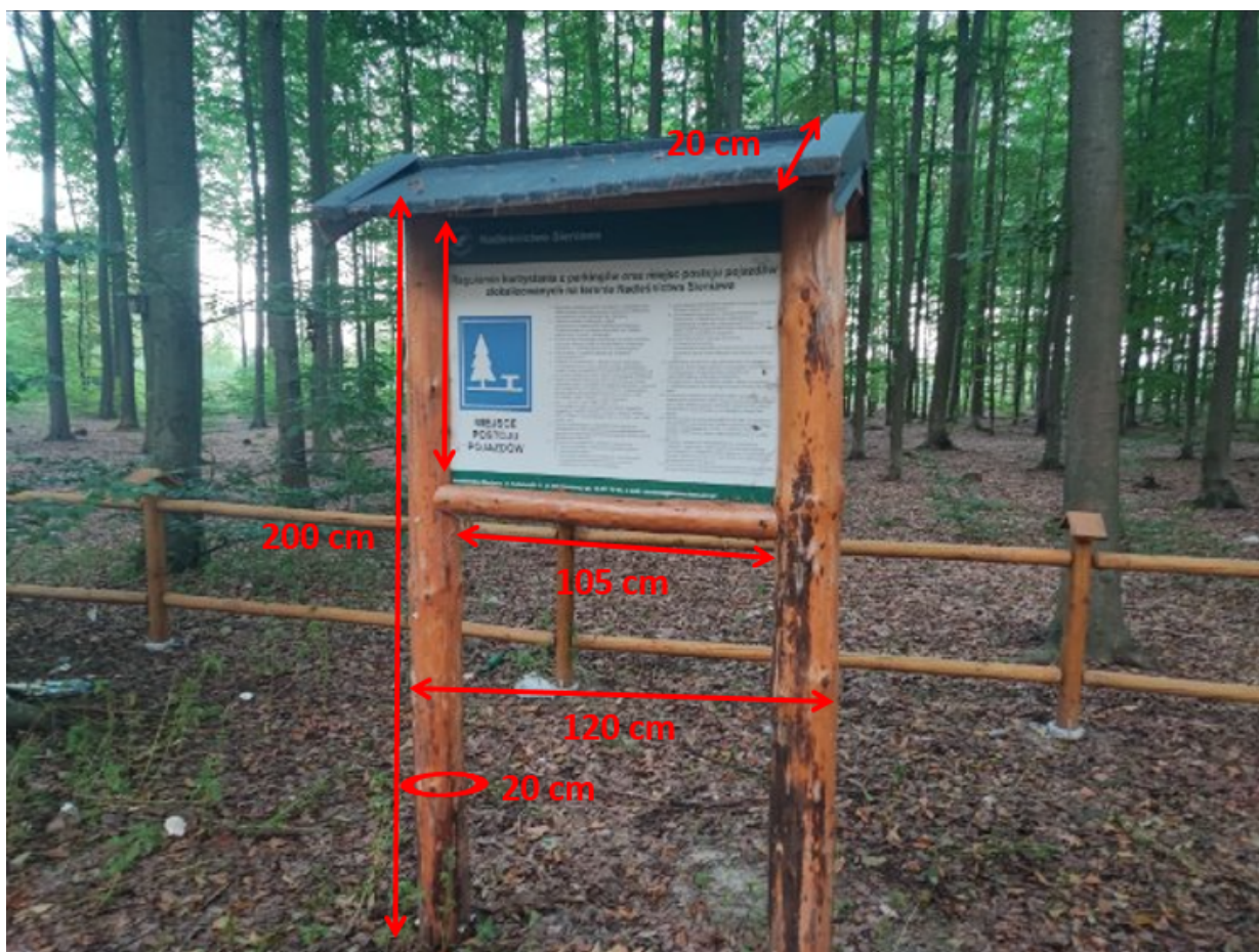
Ryc. 5 Drewniany stelaż na tablice