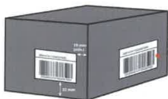
Rozmieszczenie etykiety z kodem kreskowym na jednostce handlowej niedetalicznej

Przykładowe rozmieszczenie etykiety z kodem kreskowym na jednostce handlowej niedetalicznej i logistycznej