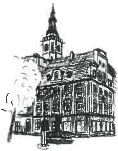
Rynek Wleża ratuszowa

Sporządziła: M. Naskręt-Kozak Stanowisko: Główny Specjalista tel. 74 856-29-23