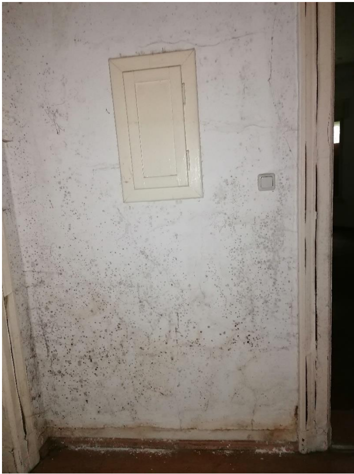
Zdjęcie nr 10