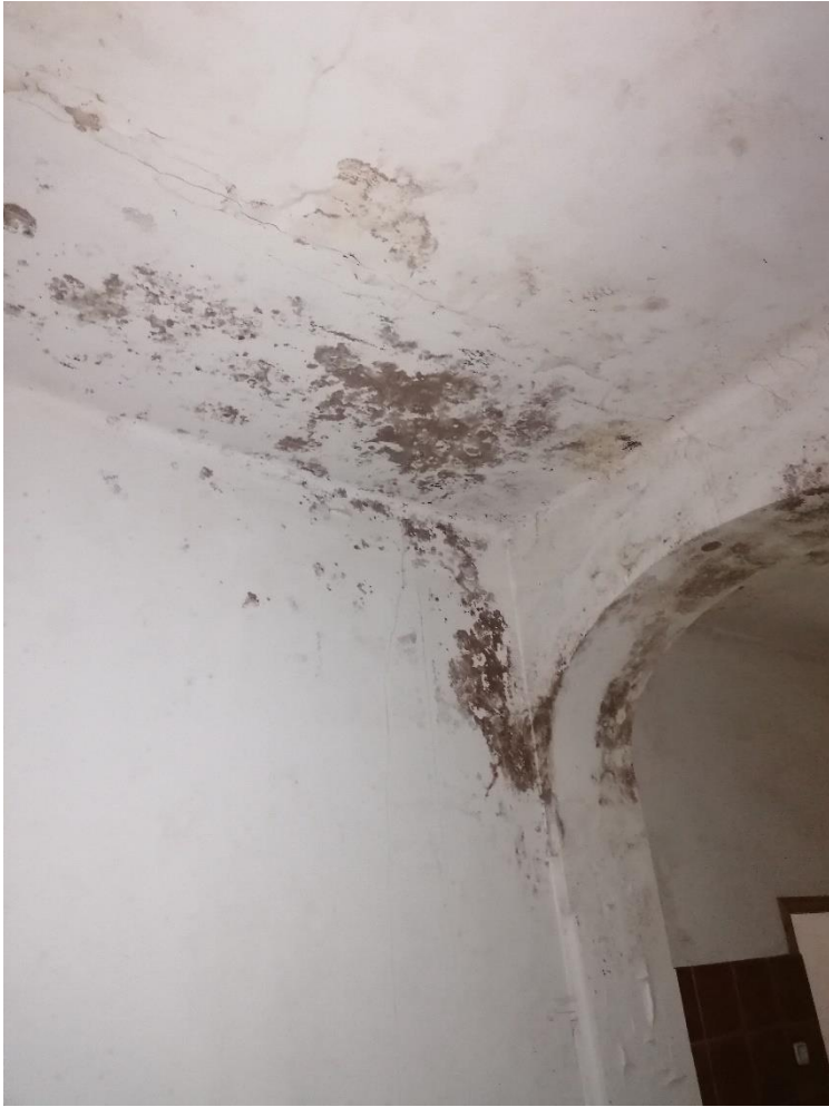
Zdjęcie nr 9