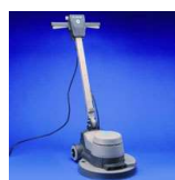
Jednotarczowa Maszyna SRP1