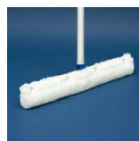
Zestaw do Nakładania Powłok Zabezpieczających