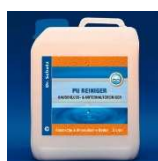
PU Środek do Codziennej Pielęgnacji