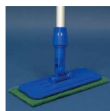
Ręczny Zestaw do Czyszczenia Padmaster