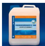
R 1000 Płyn do Codziennej Pielęgnacji