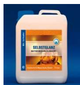
Połysk Ultra Mocna Powloka Polimerowa