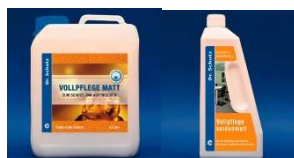
Emulsja Zabezpieczająca Mat