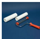
Walek Aquatop 10 mm