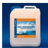
Profi Grunt Czyszczący