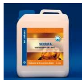
Secura Matowa Powloka Polimerowa