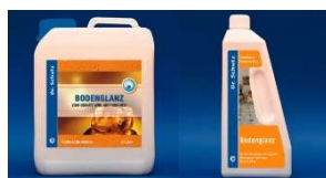
Emulsja Zabezpieczająca Połysk