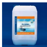
PU Siegel A: ultra mat C: mat B: ekstra mat D: polysk