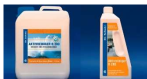
Środek do Czyszczenia Zasadniczego R280