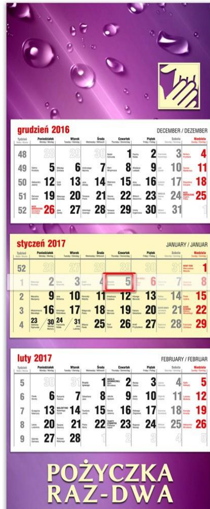
Kalendarz trójzłelny CLASSIC z nadrukiem na stopce