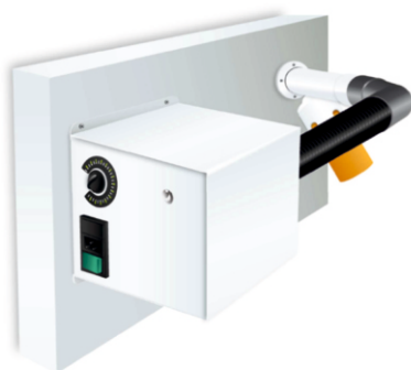
Wersja z przejściówką przez ścianę