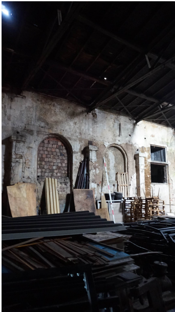
Fot.5,6 Sytuacja pod uszkodzeniem nr 2.

Opis przedmiotu zamówienia dla postępowania pn.: „Wykonanie naprawy dachu budynku Siłowni elektrycznej Bartosz zlokalizowanej na terenie północnym siedziby Muzeum Śląskiego w Katowicach” Numer postępowania: MŚ-ZP-WW-333-.../18