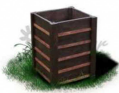
Kosz na śmieci