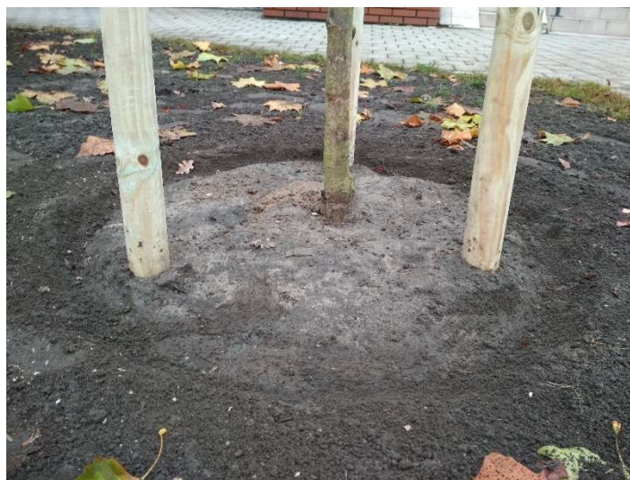
Ryc. 1 - Przykładowa misa do podlewania drzew.