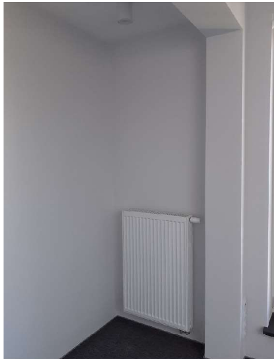
wnęka nr 19