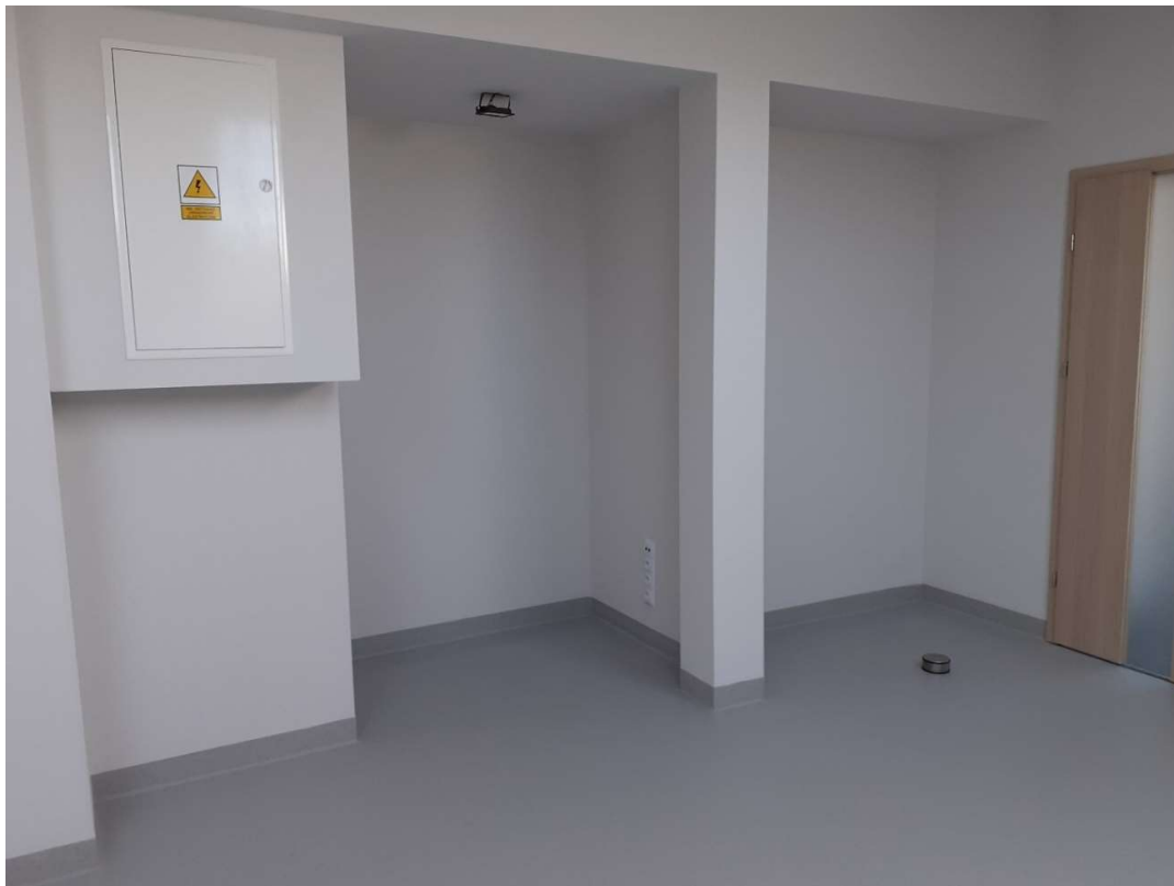
Wnęka nr 6, 7, 8 i 9 licząc od prawej