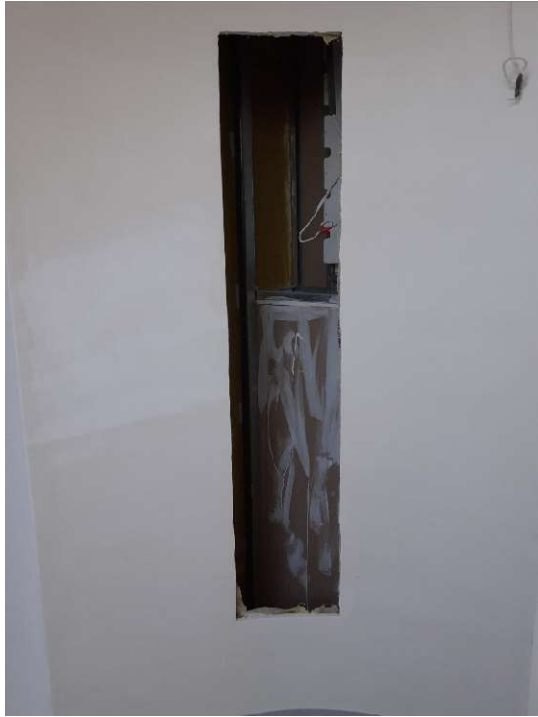
Wnęka do wykonania z płyty nr 21