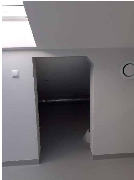
Drzwi przesuwne nr 20