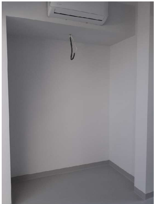
Wnęka nr 3