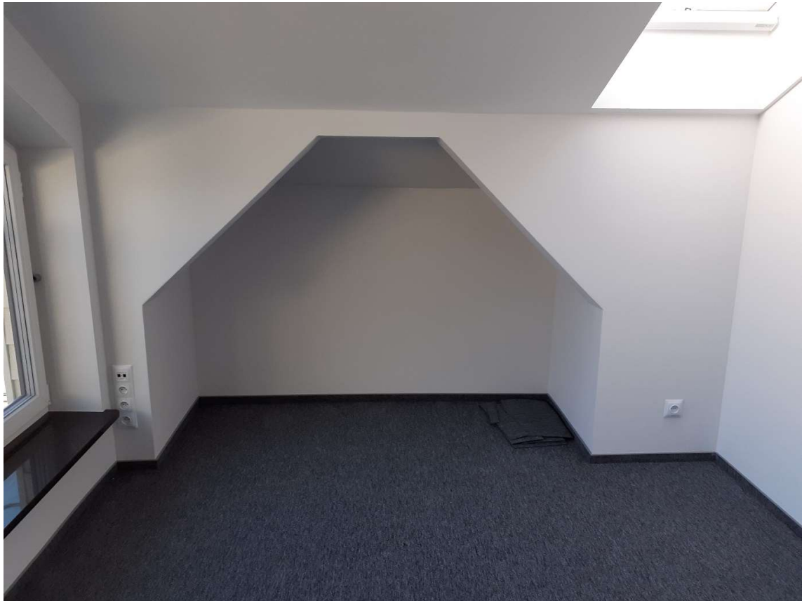
Wnęka nr 10