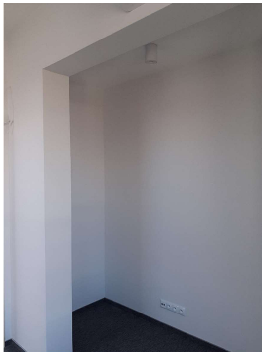
Wnęka nr 11