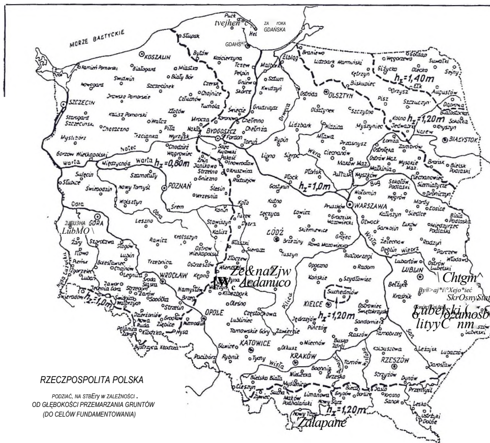
Rys. 1. Podział kraju na strefy w zależności od głębokości przemarzania gruntu (wg PN-81/B-03020)

5.3.6 Przewody sieci kanalizacyjnej na mostach, jeśli nie służą do odwodnienia jezdni i chodników, powinny być umieszczone w stalowych rurach ochronnych, zgodnie z wymogami rozporządzenia [4],