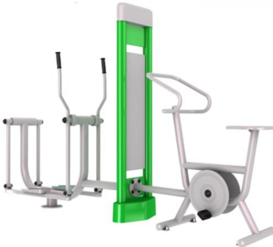
Rys.3. Narciarz i rower