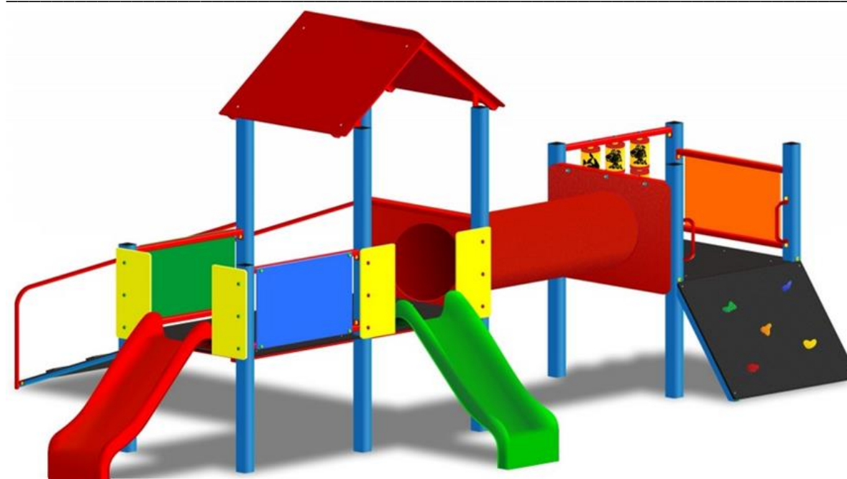
Rys.6. Zestaw zabawowy