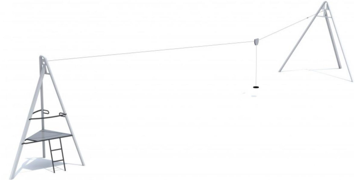
Rys. 5. Zjazd linowy