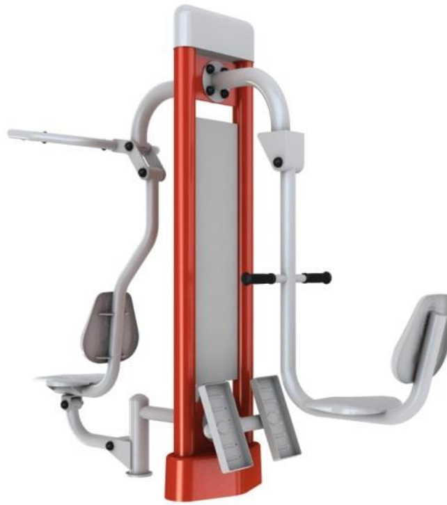
Rys.2. Wyciąg górny i prasa nożna