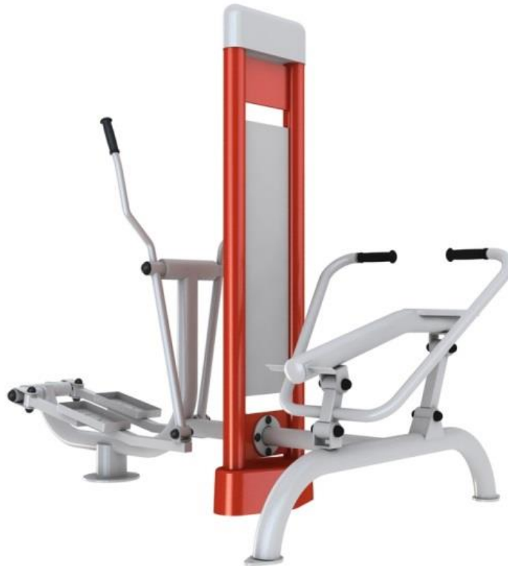
Rys. 1. Orbitrek i wioślarz na pylonie