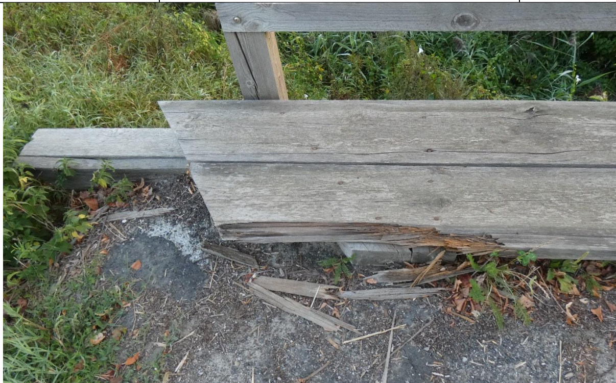
Fot. 3. Ubytki desek, korozja biologiczna