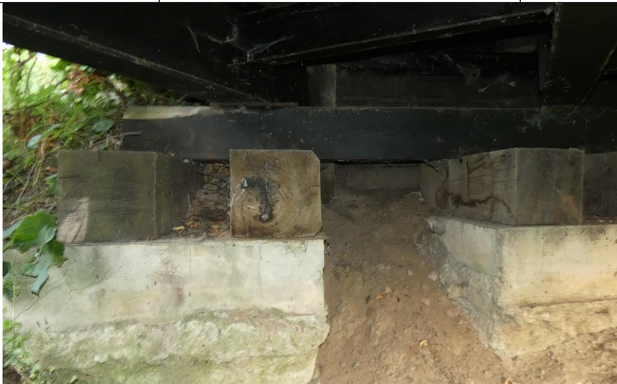
Fot. 7. Zarysowania, korozja biologiczna słupów fundamentowych, osunięcia mas ziemnych wokół fundamentów