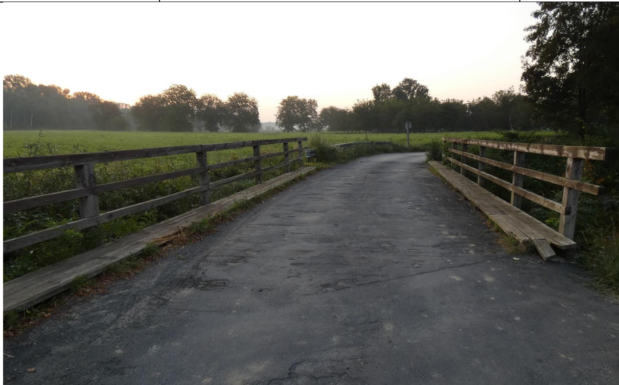
Fot. 1. Ubytki i deformacja nawierzchni na obiekcie, zanieczyszczenia nawierzchni jezdni