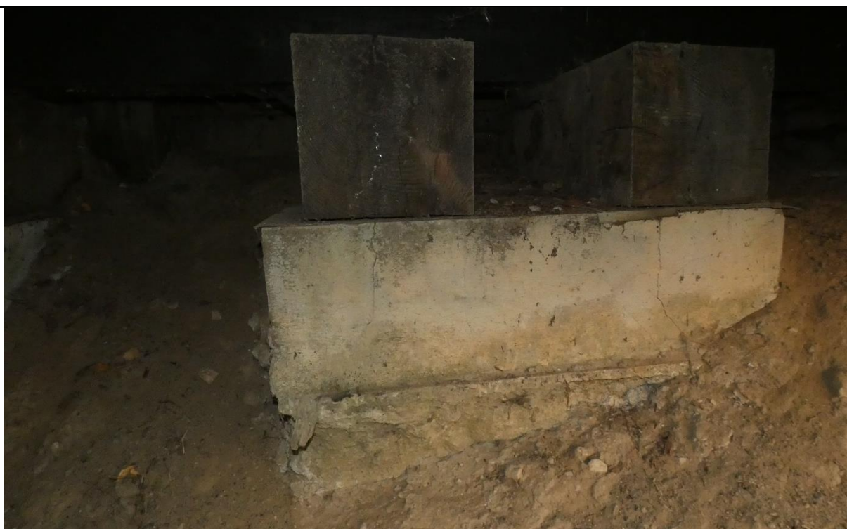
Fot. 8. Zarysowania, korozja biologiczna słupów fundamentowych, osunięcia mas ziemnych wokół fundamentów