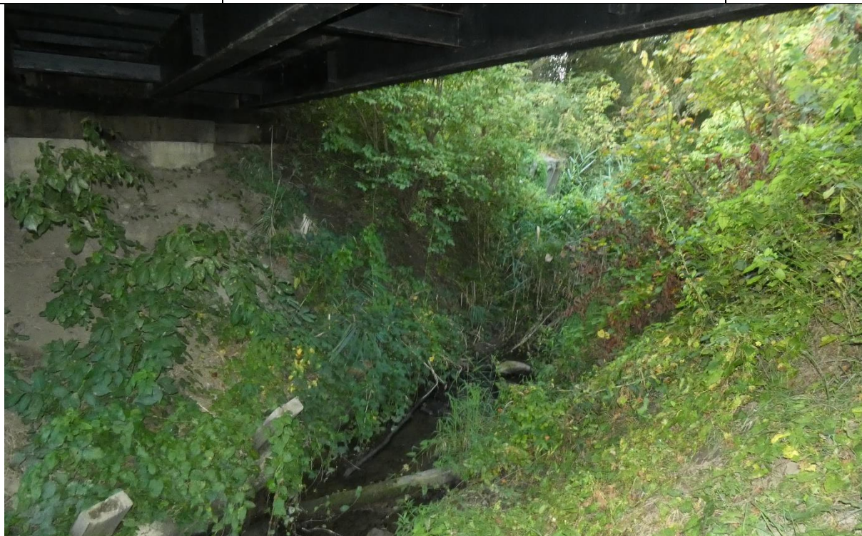
Fot. 9. Erozja i osunięcie mas ziemnych w obrębie podpór obiektu