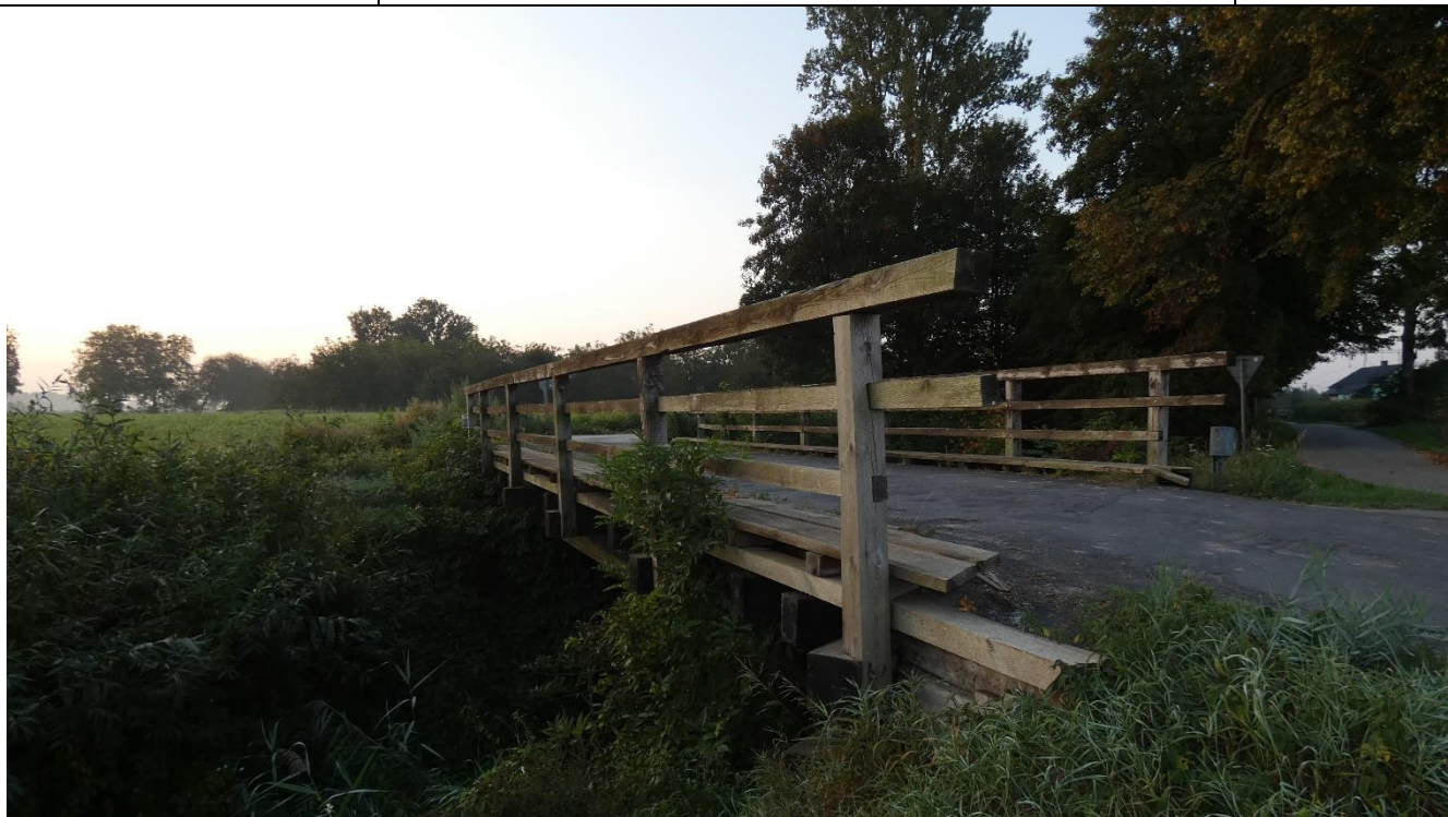
Fot. 1. Widok na obiekt