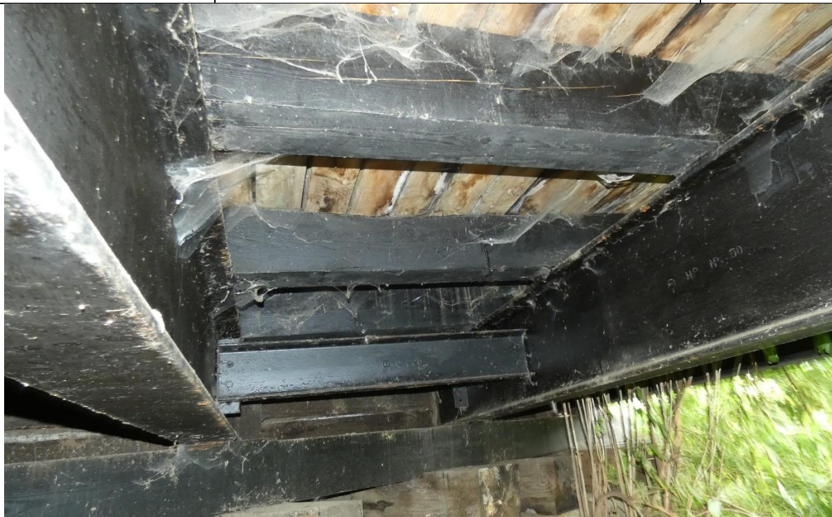
Fot. 5. Korozja biologiczna, wykwyty i gnicie drewnianej konstrukcji pomostu