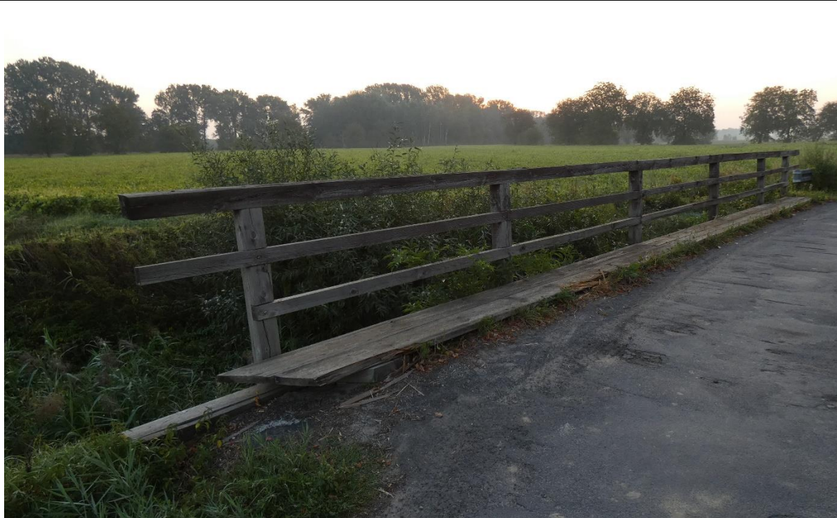
Fot. 2. Deformacja bariery na dojeździe do obiektu, korozja biologiczna, pęknięcia i ubytki materiału balustrady, deformacje