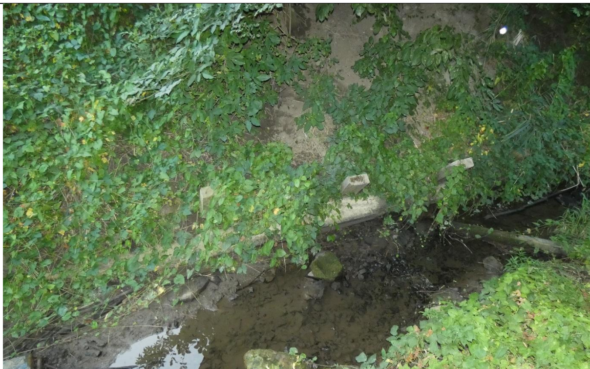
Fot. 10. Zarysowania, korozja biologiczna słupów fundamentowych, osunięcia mas ziemnych wokół fundamentów