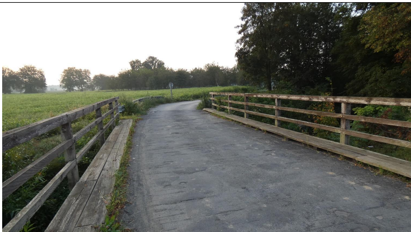
Fot. 2. Widok na nawierzchnię jezdni na obiekcie