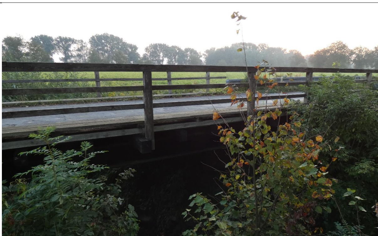
Fot. 4. Porost wysokiej roślinności w obrębie obiektu