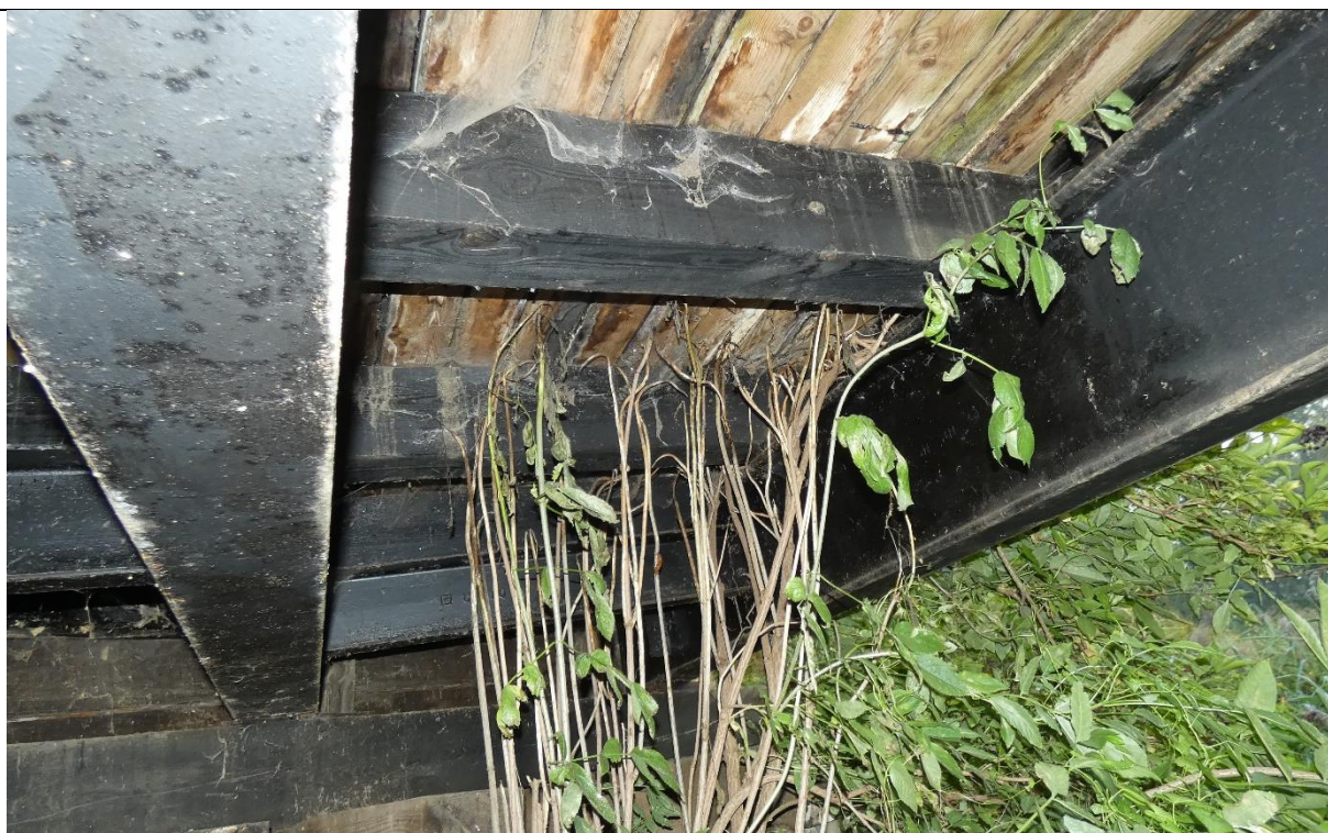
Fot. 6. Korozja biologiczna, wykwyty i gnicie drewnianej konstrukcji pomostu