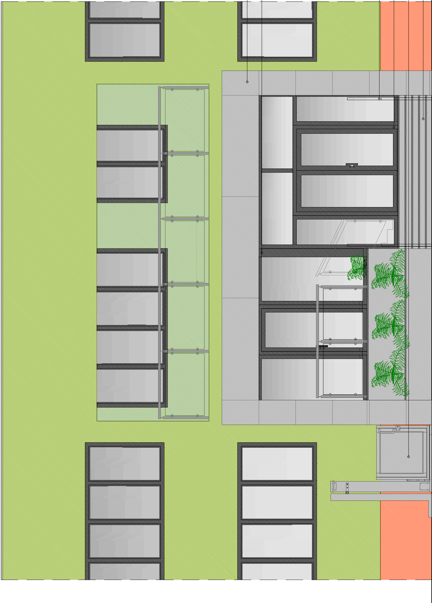
WIDOK OD STRONY PÓŁNOCNO-WSCHODNIEJ