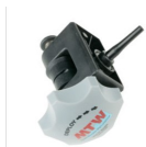
rączka z bębniem nawijającym kardridż

Czy Zamawiający dopuści zestaw do opaskowania żyłaków o następujących parametrach: Z opaskami do podwiązywania żyłaków przetyku