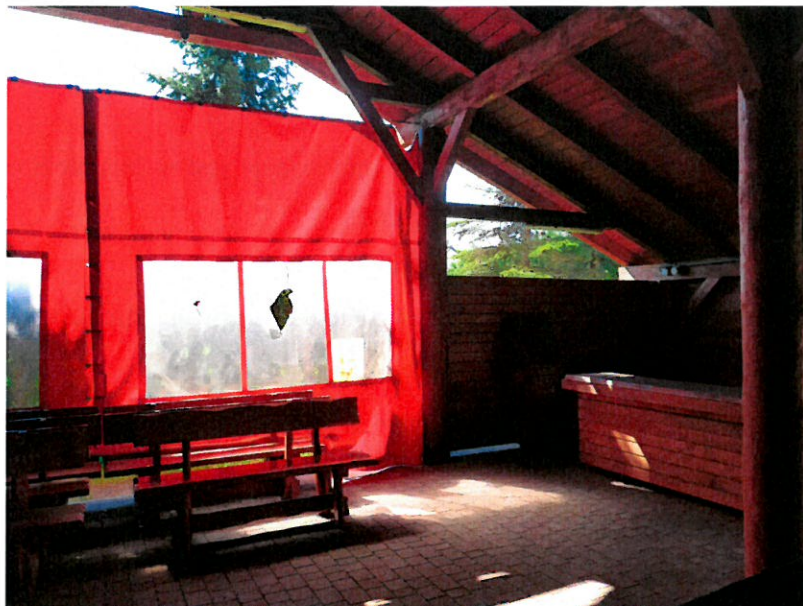
zdjęcie nr 3