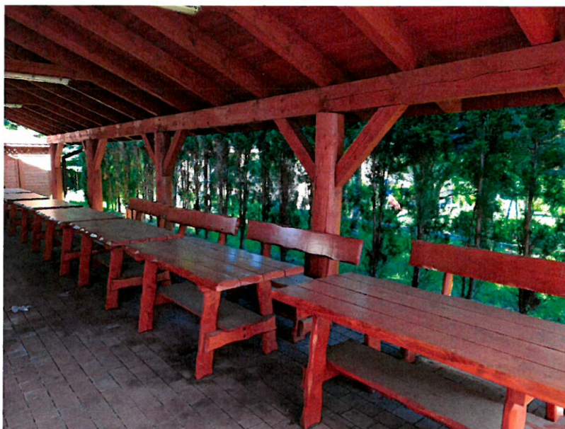
zdjęcie nr 1