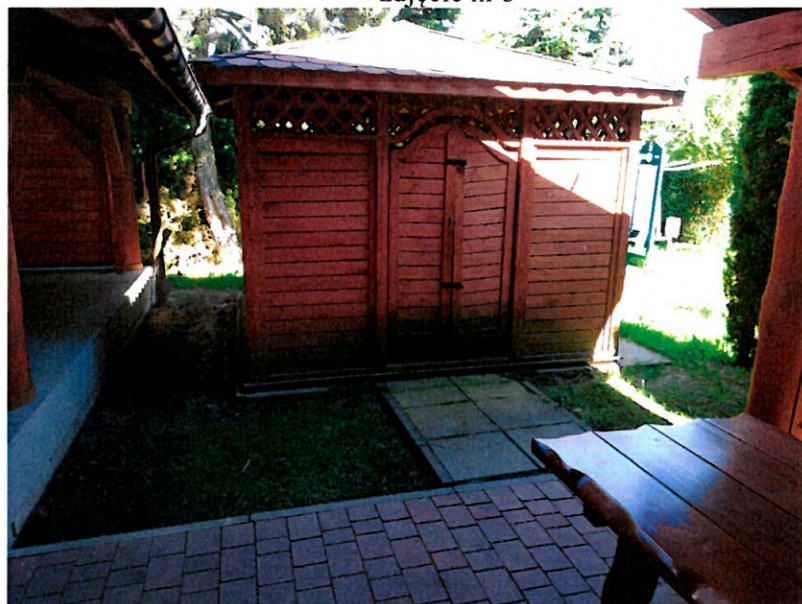
zdjęcie nr 4