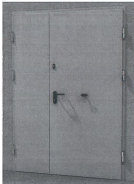
Zdjęcie poglądowe drzwi.