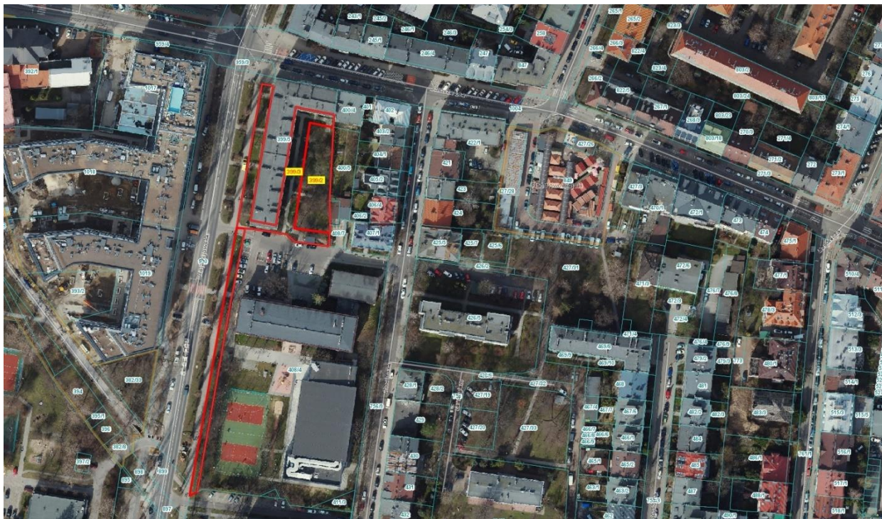
Ryc. 1. Mapa z lokalizacją przedmiotu zamówienia – Aleja Kijowska 10, działki nr 399/2, 399/3, 408/5 K-4.

Miejsce wykonania przedmiotu zamówienia obejmuje działki nr 399/2, 399/3, 408/5, obręb nr 4, jednostka ewidencyjna Krowodrza, przy Alei Kijowskiej 10 w Krakowie.