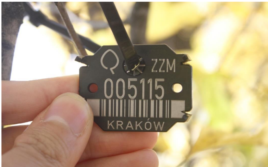
Sposób prowadzenia opaski.