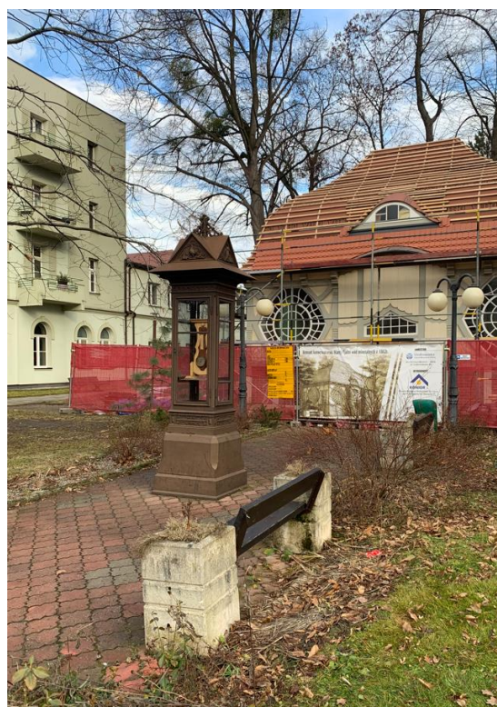
Rys. 2,3 Widok ogólny terenu – od strony drogi dojazdowej.