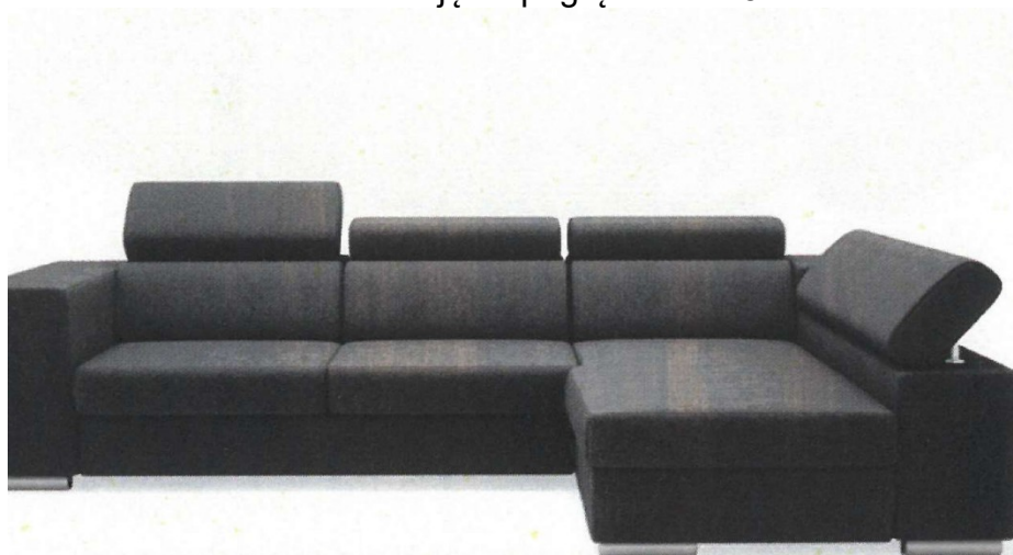
Zdjęcie poglądowe nr 5

Wzór sofy przedstawia zdjęcie poglądowe nr 5.