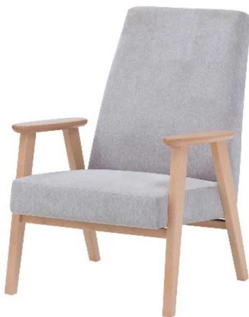
Zdjęcie poglądowe nr 1

Wzór fotela klubowego - drewnianego przedstawia zdjęcia poglądowe nr 1 i nr 2.