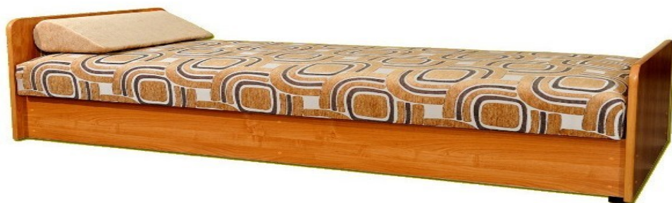
Zdjęcie poglądowe nr 3

Przykładowy wygląd tapczanu tapicerowanego przedstawia zdjęcie poglądowe nr 3.