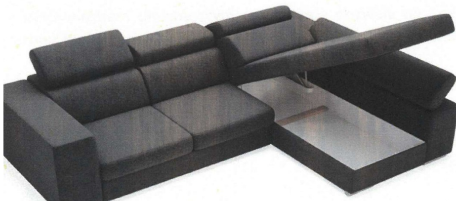
Miejsce dostawy kanapy: