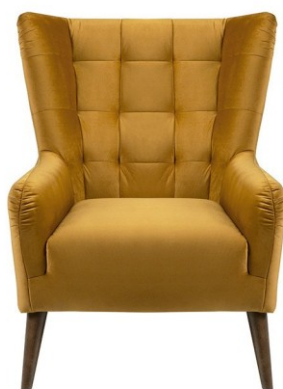
Zdjęcie poglądowe nr 8

Fotele należy oznakować symbolem WP8-5-21 pod spodem, na środku siedziska. Oznakowanie wykonać niezmywalnym markerem w kolorze białym. Wysokość i szerokość liter i cyfr ma mieć następujące wymiary: wysokość od 1,5 cm. do 2 cm.; szerokość od 0,5 cm. do 1 cm.