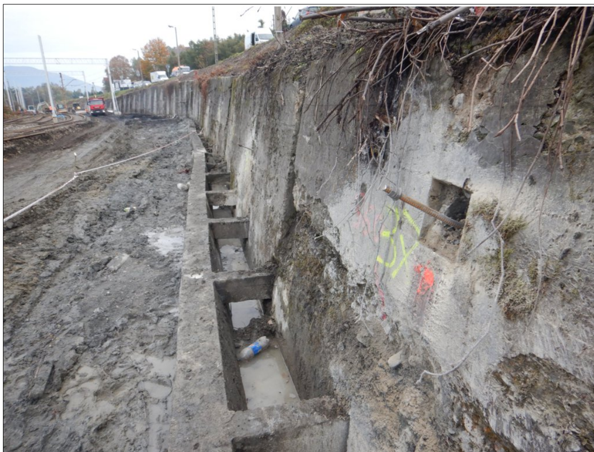
Uszkodzony i spękany mur oporowy nad torami kolejowymi