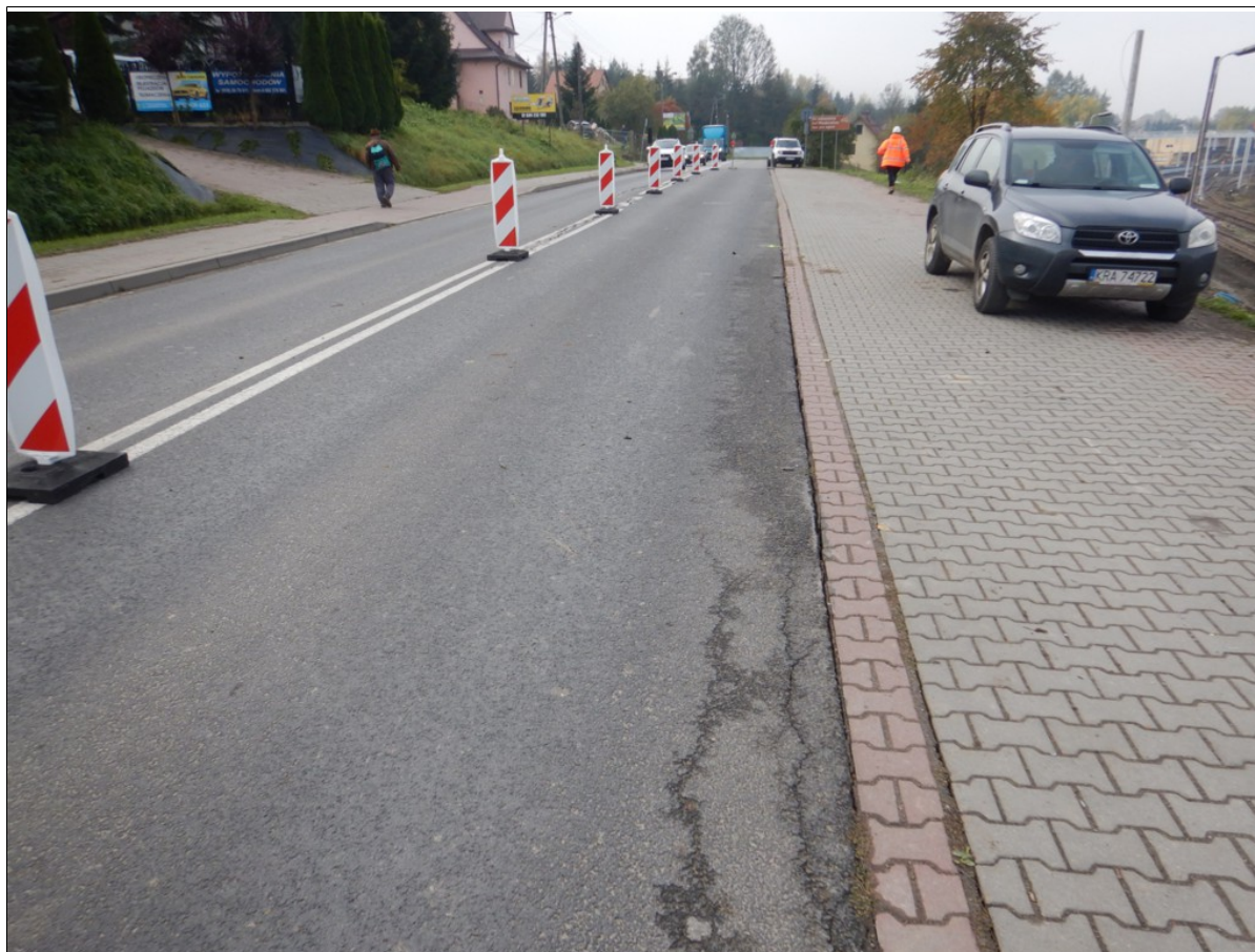
Uszkodzenie chodnika i szczelina przy jezdni asfaltowej