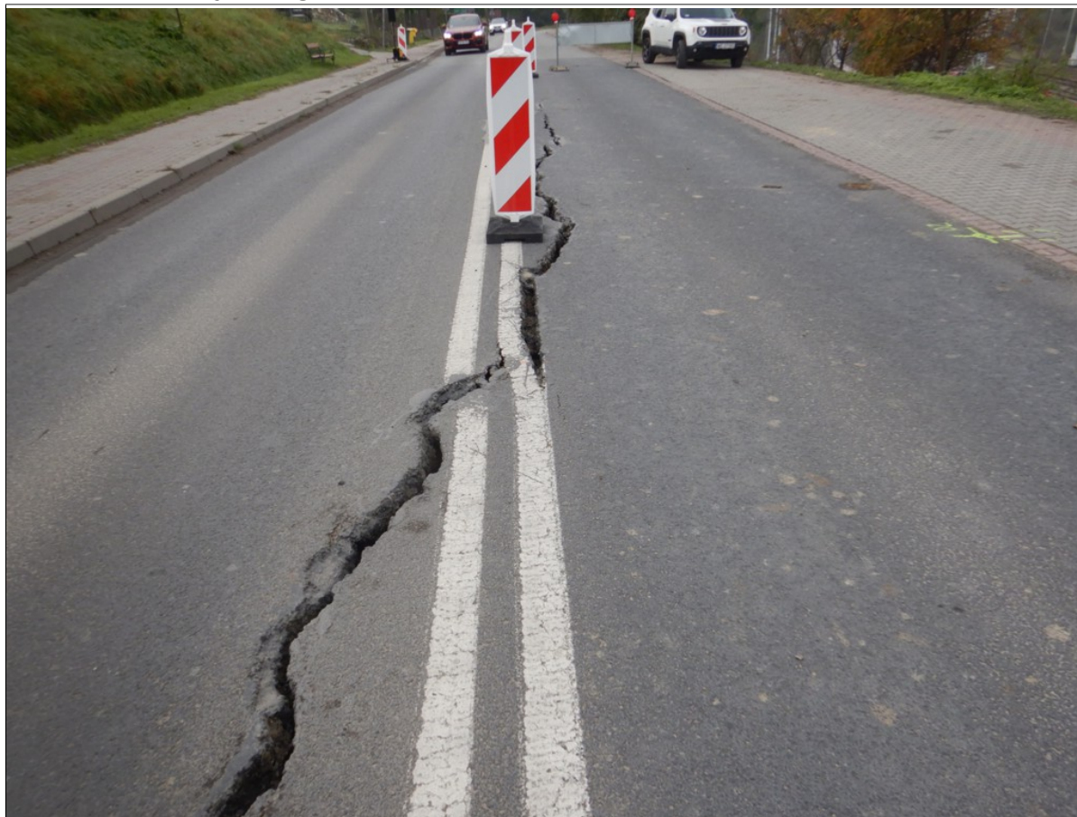
Skarpa główna osuwiska