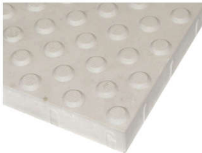
Rys. 2a. Płytki ostrzegawcze – szczegóły powierzchni