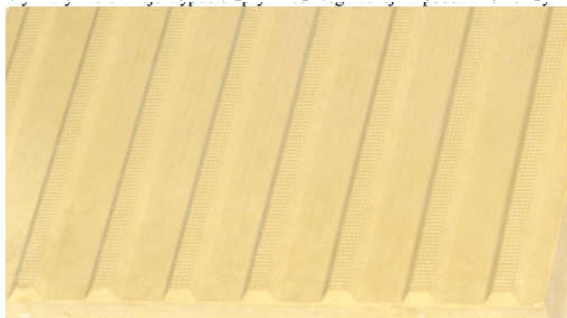
Rys. 1a. Płytki kierunkowe symetryczne - prowadzące - szczegóły powierzchni

Wymiary i tolerancje wypustek płytki ostrzegawczej na podstawie normy DIN 32984 podano na rys. 2b.