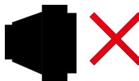
Niedozwolony typ adaptera

UWAGA! Zamawiający nie dopuszcza adapterów w postaci pojedynczej wtyczki.