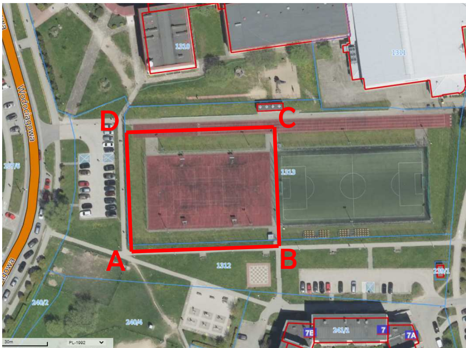
Rysunek 2 Zakres obszaru opracowania