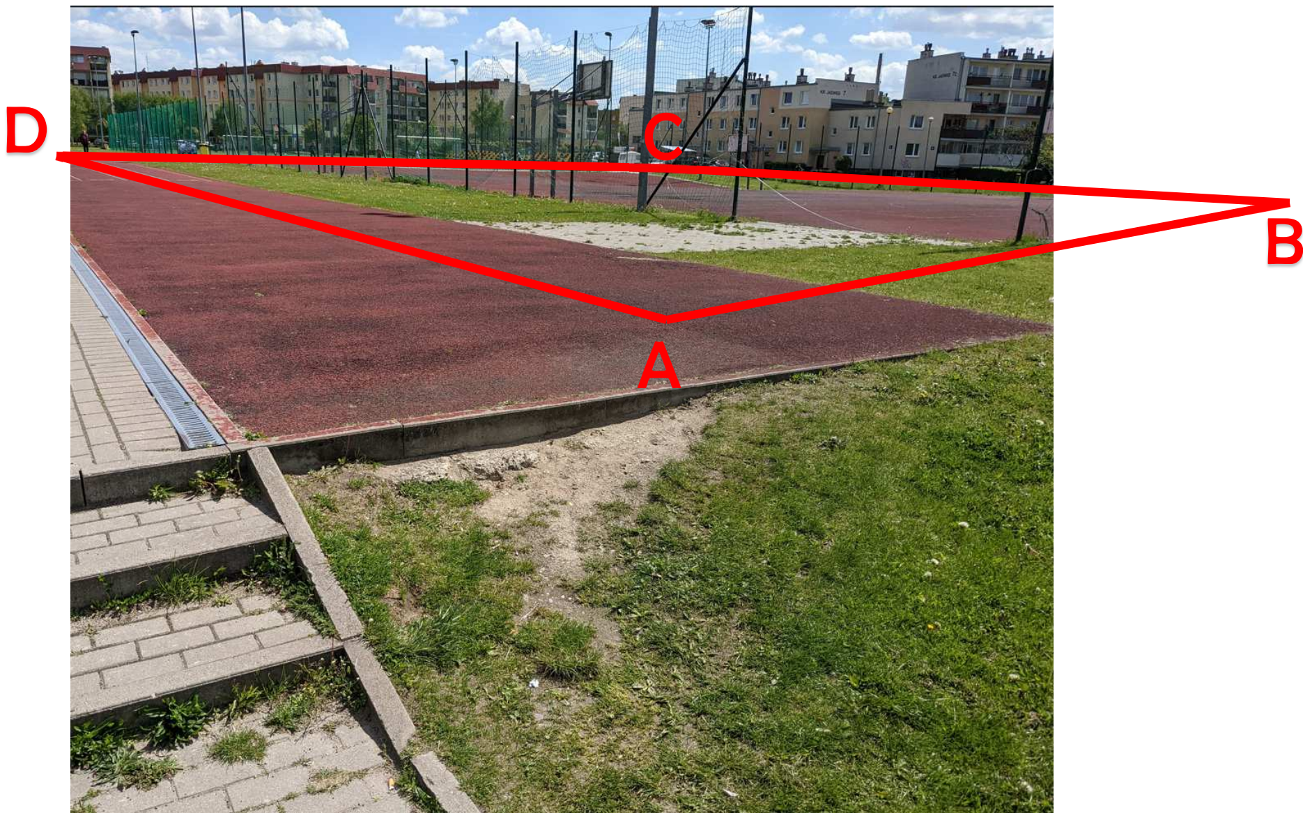
Rysunek 1 - poglądowe zdjęcie terenu