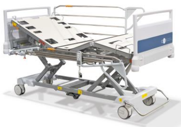
(Zdjęcie poglądowe oferowanego łóżka)

31. Prosimy (w pkt. 8) o doprecyzowanie parametrów stolika przyłóżkowego.