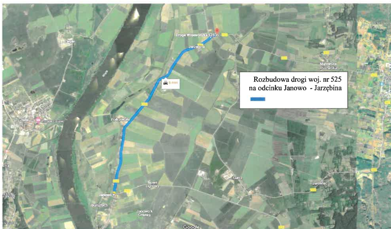
Rysunek 2. Miejsce inwestycji