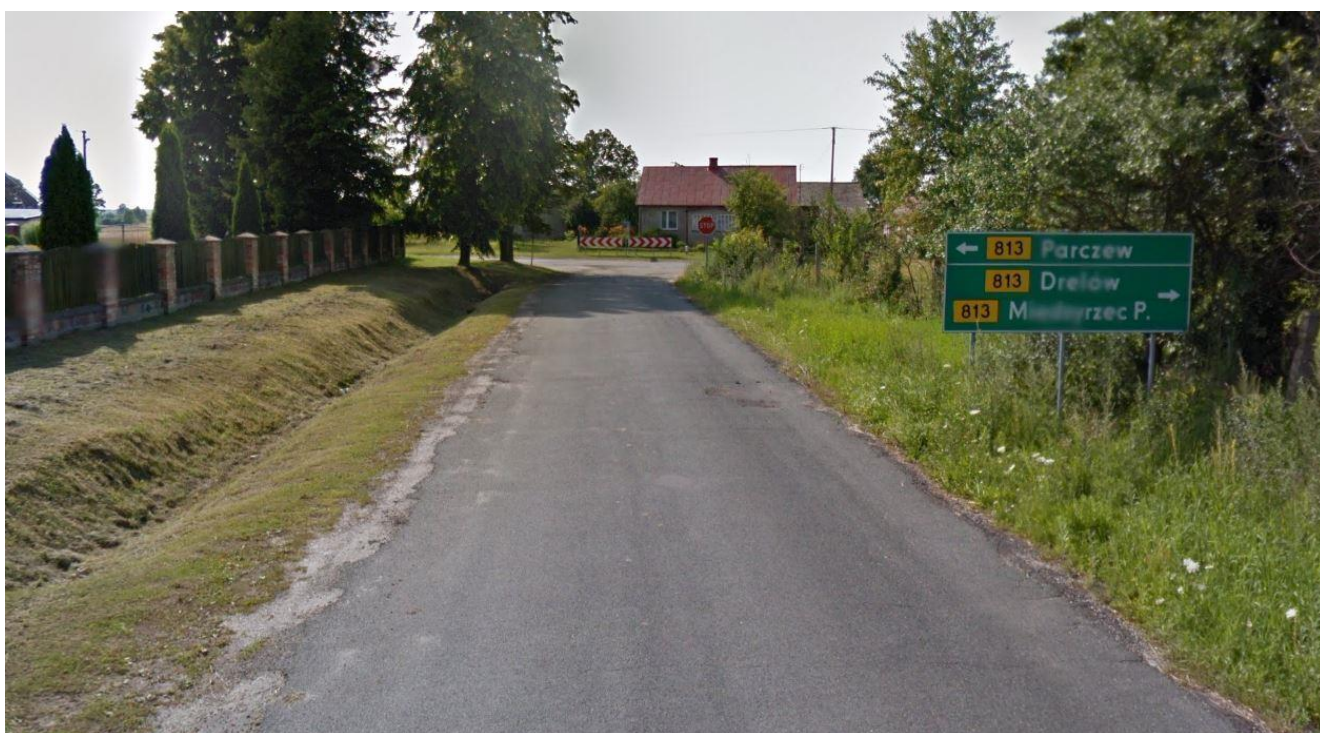
Koniec zadania km 5+609