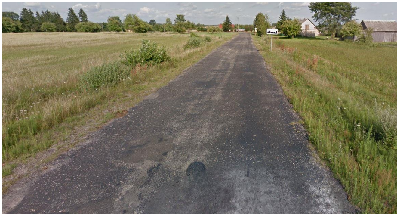
Początek zadania km 0+018