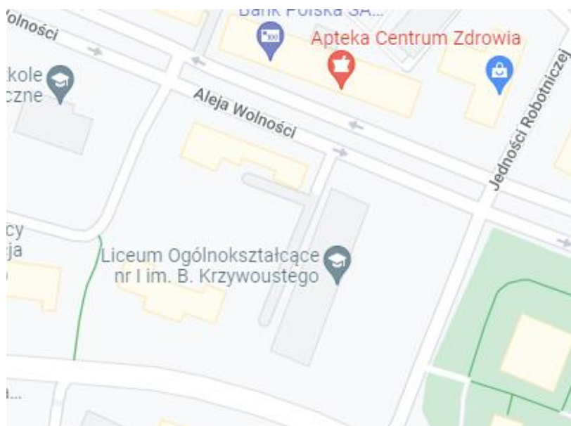
Rysunek 2