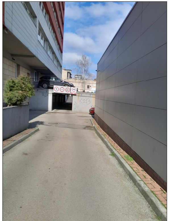
fot.6 - zjazd do garażu - koniec opracowania