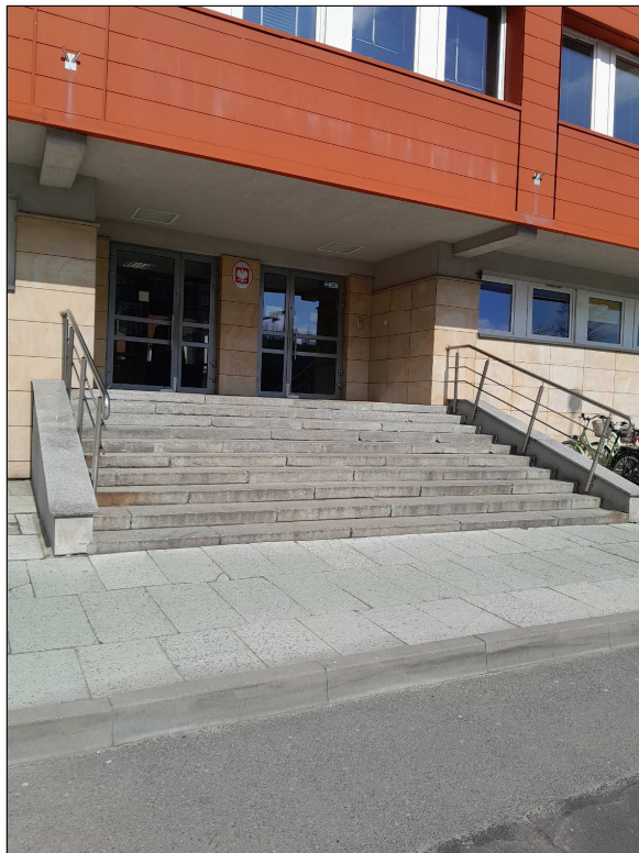
fot.5 - schody zewnętrzne