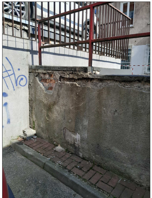
fot.8 - mur oporowy 2